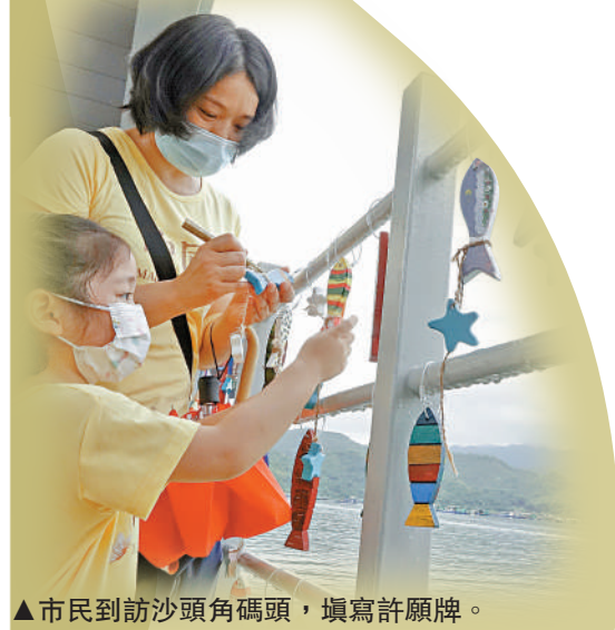
▲市民到訪沙頭角碼頭，填寫許願牌。