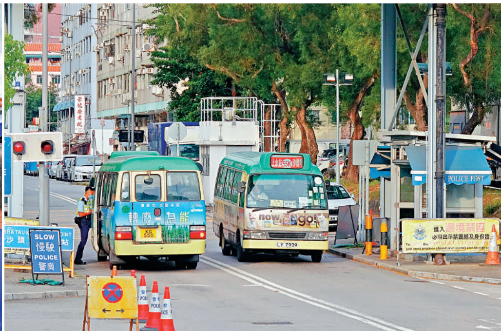
沙頭角公共交通配套不足，目前僅靠小巴和巴士接駁，遊客量增加時難以應付需求。