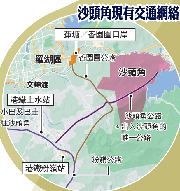
沙頭角現有交通網絡