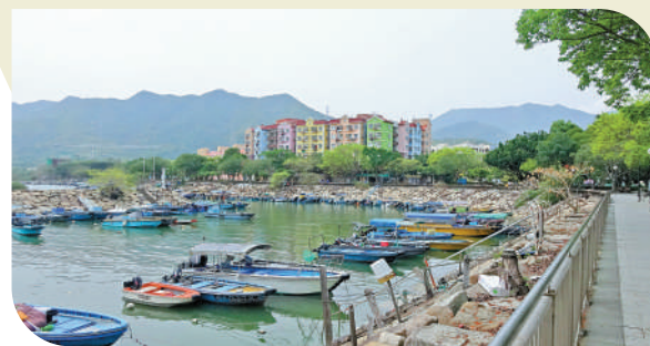
▲沙頭角擁有豐富的旅遊資源，但必須優化交通配套，才可發展成重要的旅遊消費區。