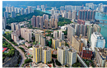
▲本地銀行連續加息，已令樓市出現震盪。

總括而言，儘管未知聯儲何時才重啟減息，但加息周期已告一段落，對後市有一定的支持作用。五窮六絕七翻身，5月窮快過去，6月美國停止加息，對樓市是好消息，配合疫後經濟改善，7月樓市勢必全面翻身。