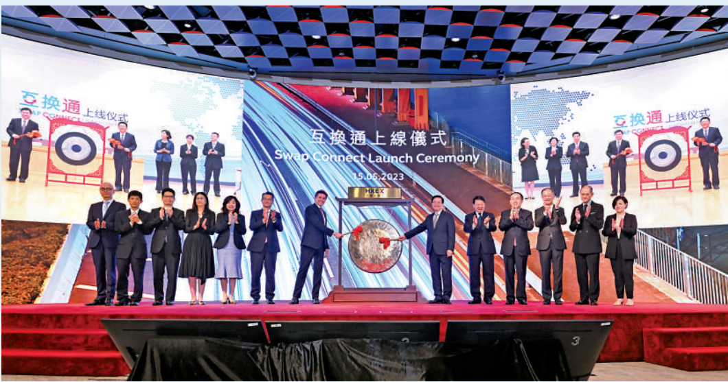
「互換通」上線儀式於本月15日在港交所的香港金融大會舉行。

總體來看，地方債務風險可控，但也需警惕與情過度發酵引起的估值波動。2023年以來，城投市場非標與情相對較多，且市場對於地方債務問題的關注度較高，但筆者對城投市場仍保持信心，未來出現實質性違約的概率較低，整體風險處於可控區間。當前隨着市場的不斷發展成熟，點狀與情對地區估值和利差的實質性衝擊相對有限，但也需要警惕與情過度發酵導致估值有所波動。因此短期內為降低估值波動帶來的影響，建議關注穩定區域的團區類城投配置機會，而長期可以關注部分受到估值錯殺影響且債務化解較為積極的地區投資價值。