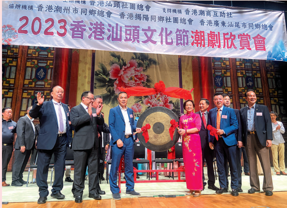
▲眾嘉賓為潮劇專場演出舉行啟動禮。