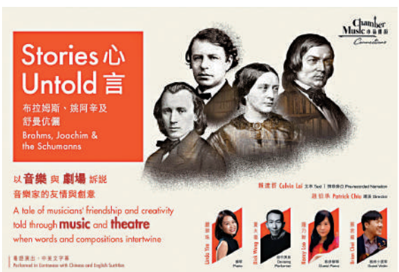
▲「心言：布拉姆斯、姚阿辛及舒曼伉儷」音樂劇場6月推出。

時間：6月21日晚上8點 6月22日下午2點半 地點：香港文化中心劇場 費用：港幣280元、350元