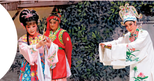
▲潮劇《陳三五娘》選段之「觀燈」，講述發生在元宵燈會的才子佳人故事。