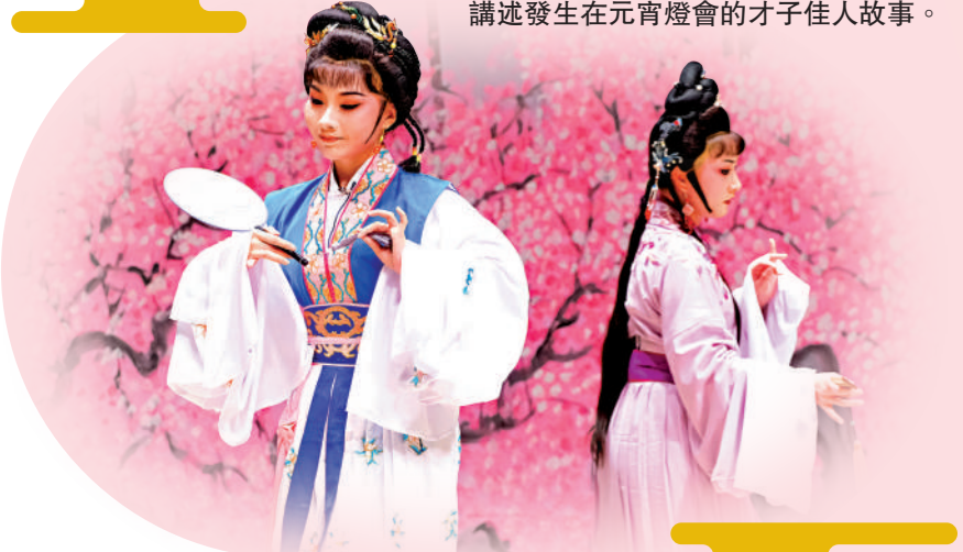
▲潮劇《陳三五娘》之「花園盟約」。

「花園盟約」一折，講的是黃府家規嚴格，陳三和五娘為解相思之苦，故請益春喚陳三來花園相會，互訴衷腸。