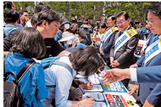
▲韓國民眾簽名反對日本核污水排海。

韓國民眾對旭日旗有強烈的抵觸情緒，但推進改善對日關係的尹錫悅政府認為懸掛軍隊旗幟是「國際慣例」。