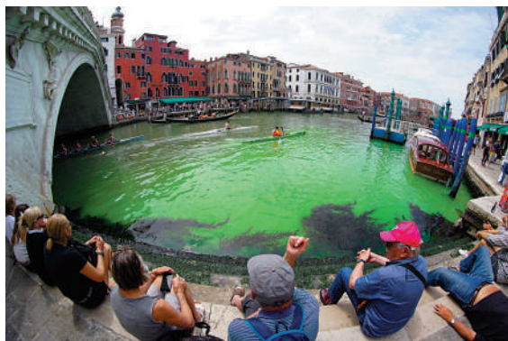
▲威尼斯大運河部分水域28日呈現綠色。

意大利消防部門表示，正在幫助地區環境保護機構採集樣本進行測試。初步調查顯示，綠色物質是一種通常用於追蹤水流的螢光素。當地環保署官員表示，從綠色斑塊的大小來看，至少有1公斤螢光素被傾倒在水中，很難