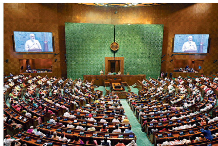
▲莫迪在演講中表示要徹底拋棄殖民心態。

莫迪出任印度總理以來，致力於改變該國帶有英國殖民主義色彩的標誌，營建新議會大樓就是一個例子。這棟新議會大樓斥資1.45億美元（約11.3億港元），毗鄰由英國建築師設計、於英國殖民時期興建的原議會大樓。為紀念新議會大樓啟用，印度將發行面值75盧比的特別硬幣。