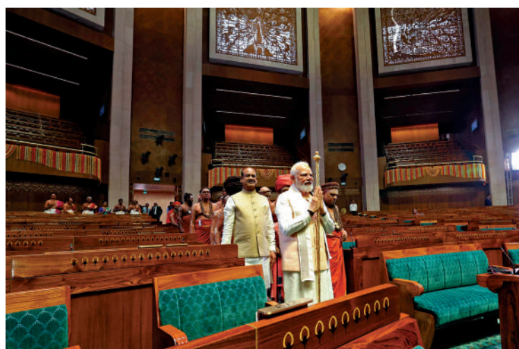
▲莫迪28日手持金色權杖現身典禮現場。

【大公報訊】綜合CNN、路透社、美聯社報道：印度總理莫迪28日主持新議會大樓落成典禮，取代英國殖民時期興建的舊議會大廈。印度長期以來尋求消除英國殖民主義痕跡，莫迪當天在典禮上表示，印度曾是一個繁榮的國家，但英國數百年的殖民統治剝奪了印度人的「自豪感」，直到今天，印度已徹底拋棄殖民心態。