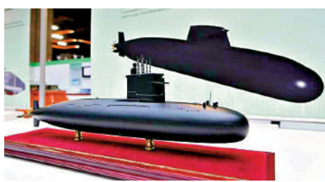
▲台灣潛艇原型艇模型。 資料圖片

據台媒此前報道，為了讓當局領導人蔡英文卸任前可親自主持「下水典禮」，這艘拼湊的台造潛艇搞出的「觸水不下水」戲碼，實則是一場「政治下水」鬧劇。蔡英文上台以來，推動軍備「自產自造」。2017年，民進黨當局通