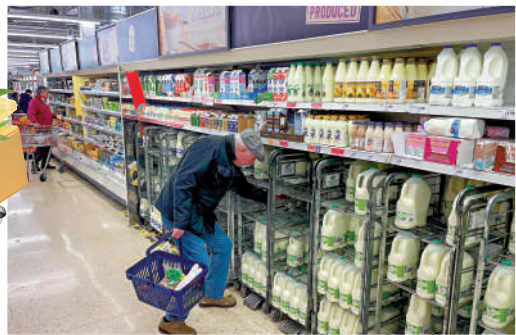
▲蘇納克希望對牛奶等食品實施限價，但超市表示反對。

英國內政大臣布雷曼近期捲入徇私枉法風波，被指曾在收到超速罰單時要求公務人員為其安排一對一的駕駛安全課程。外交大臣克萊弗利上周被曝用豪華噴氣式飛機出訪，工黨抨擊此舉凸顯了蘇納克政府與公眾脫節。上月，副首相拉布因涉嫌恐嚇公務人員而辭職。大公報整理