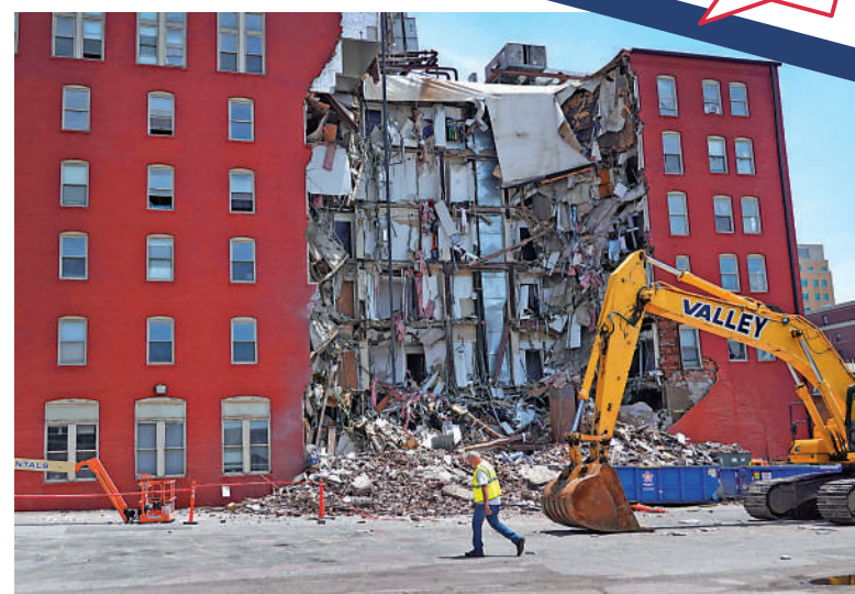
▲艾奧瓦州一棟公寓樓28日部分坍塌，樓內可能仍有人被困。