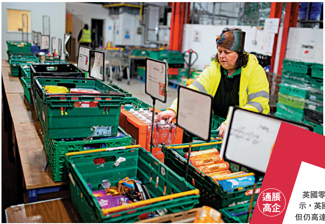
▲越來越多的英國民眾到食物銀行領救濟，圖為今年初食物銀行員工整理各類食品。

《衛報》稱，「貪婪通脹」（greedflation）可能是食品漲價的另一個原因。「貪婪通脹」指企業以通脹為藉口提價，但在成本回落時拒絕降價，以牟取暴利。本月稍早，英國議會下議院環境、食品及農村事務委員會表示，將調查食品供應鏈的利潤和風險分擔情況。