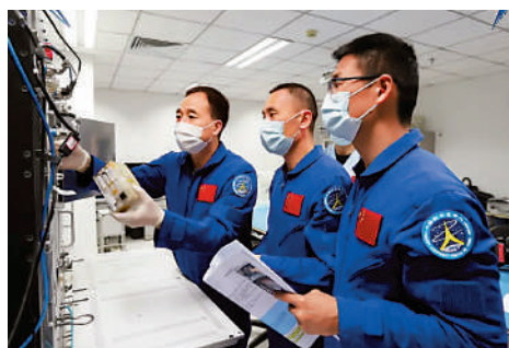
▲神舟十六號乘組在地面進行醫學研究項目操作。

此前，多位航天員曾在空間站種植果蔬。黃偉芬表示，神舟十六號航天員也將在太空親手種植果蔬。為此，神舟十六號飛船搭載了一個植物栽培裝置，可以在太空為飛行乘組提供少量新鮮蔬菜和水果，期望能有收穫，也期望為空間站創造綠色鮮活的艙內環境。同時，還可以通過植物栽培活動，正向調節航天員的情緒和心理。