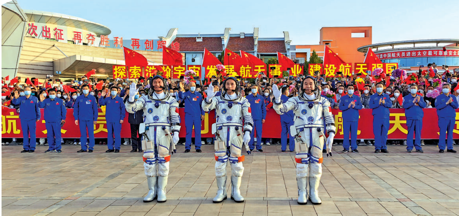
▲5月30日6時42分，神舟十六號載人飛行任務航天员乘組出征儀式在酒泉衛星發射中心問天閣圓夢廣場舉行。這是航天员景海鵬（右）、朱楊柱（中）、桂海潮在出征儀式上。