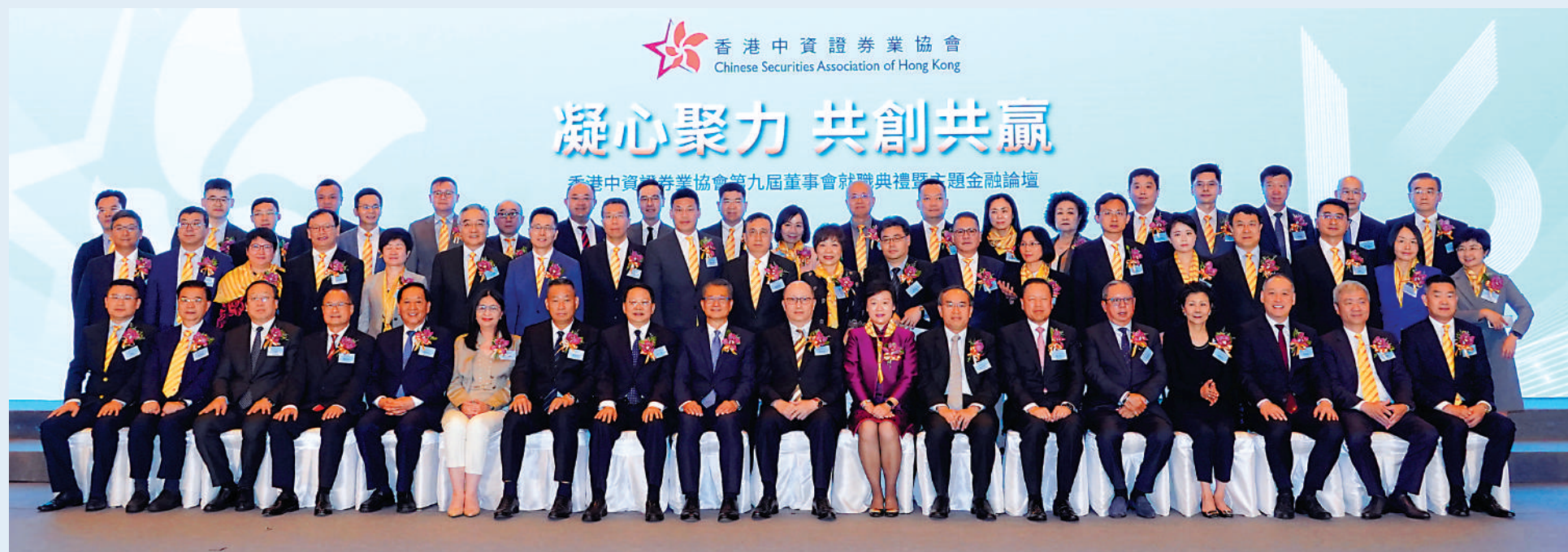
▲中聯辦主任鄭雁雄（前排左十）、財政司司長陳茂波（前排左九）等嘉賓，昨出席香港中資證券業協會第九屆董事會就職典禮暨主題金融論壇。