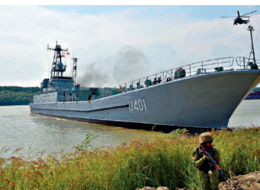
▲烏海軍戰艦「尤里·奧列菲連科」號。

英國外交大臣克萊弗利則表示，烏方有權襲擊境外目標進行「自衛」。英媒認為，克萊弗利表現出對烏軍越境襲擊的支持態度，意味着「與華盛頓的決裂」。俄聯邦安全會議副主席梅德韋傑夫5月31日發推文回應，英國實際上對俄羅斯「不宣而戰」，其官員可被視為俄方合法打擊的軍事目標。