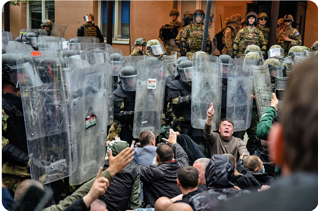
塞族示威者與北約維和士兵對峙。