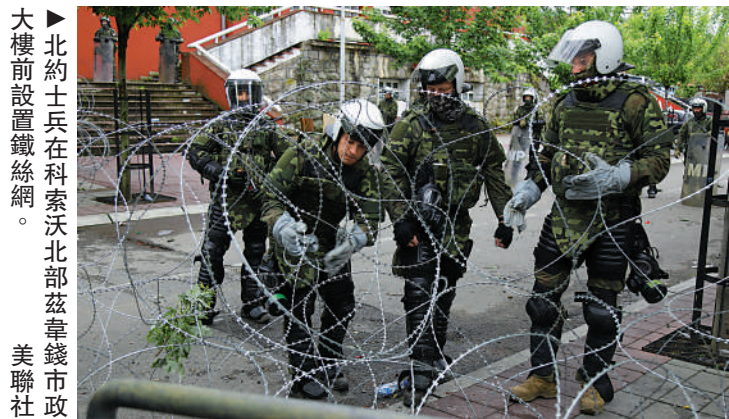
北約士兵在科索沃北部茲韋錢市政大樓前設置鐵絲網。

俄羅斯外交部發言人扎哈羅娃當天表示，北約部隊只會加劇科索沃當局與當地塞族人之間的敵對關係，該地區局勢已達到「臨界紅線」。她敦促西方「停止虛假宣傳」，停止指責塞族人挑起事端，「在尋找罪魁禍首的時候，美國和歐盟應該敲起勇氣，照照鏡子」。