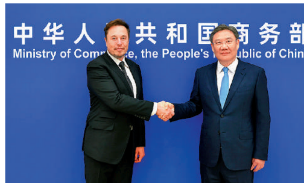
▲5月31日，商務部部長王文濤（右）會見馬斯克。