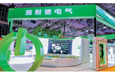
▲第五屆進博會上的施耐德電氣展台。