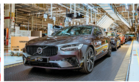
▲一輛沃爾沃汽車駛出大慶工廠總裝車間的尾線。