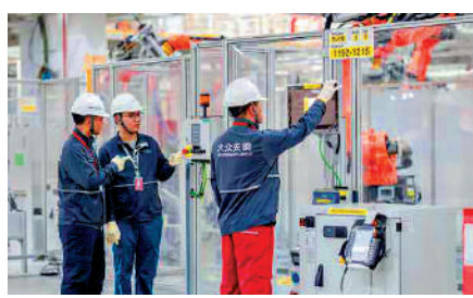
▲大眾安徽汽車電子電氣架構工廠內，員工監測設備運行狀態。