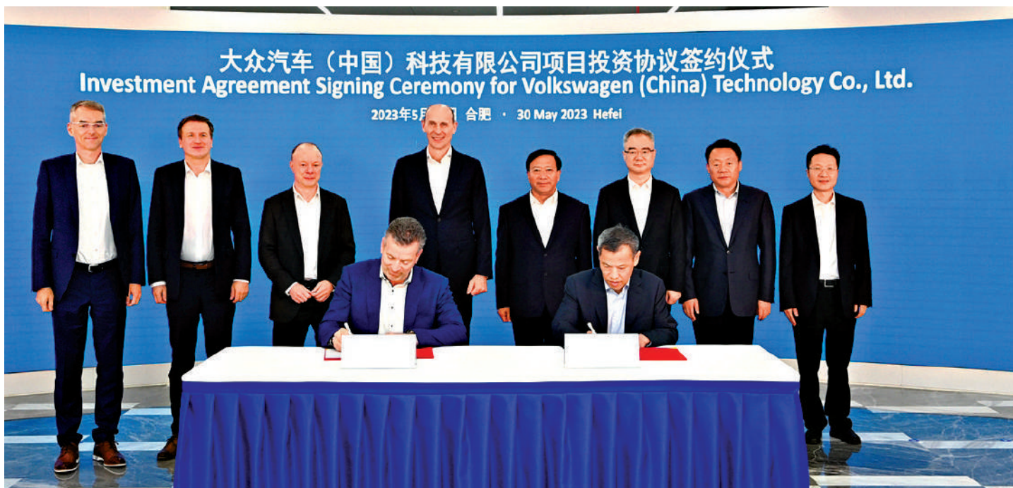
▲5月30日下午，大眾汽車（中國）科技有限公司項目簽約儀式在合肥舉行，這是德國大眾集團在華的新能源車旗艦項目。