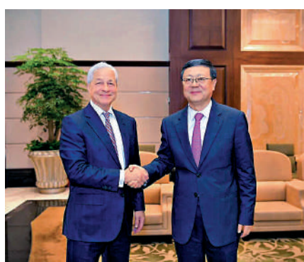
▲5月30日，上海市委書記陳吉寧（右）會見了美國摩根大通集團董事長兼首席執行官傑米·戴蒙。

摩根大通中國區首席執行官梁治文表示，中國在後疫情時代正進一步深化結構性改革，擁抱科技創新，推動資本市場的加速發展。對全球投資者而言，更深入地了解中國市場無疑具有前所未有的重要意義。