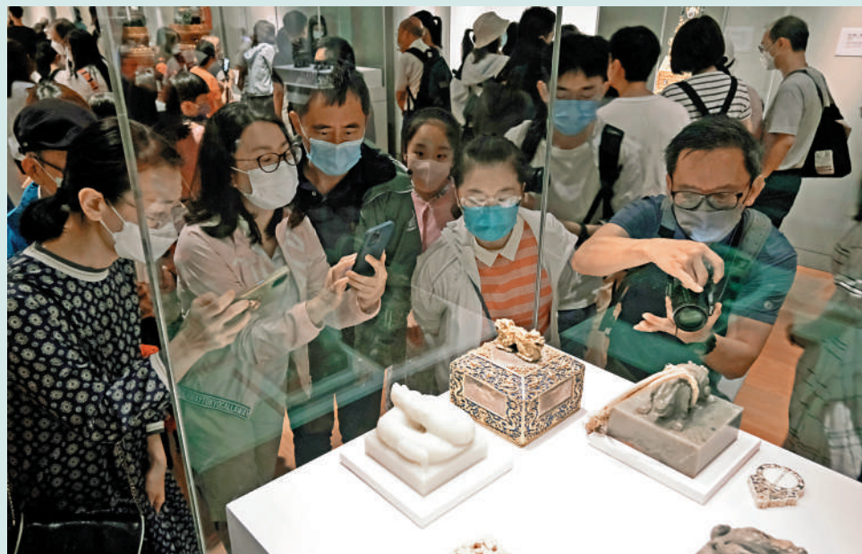
▲近年香港不少文化基建相繼落成，因此亟需培養文化管理人才推動產業發展。圖為市民參觀香港故宮文化博物館。

學費：每年人民幣5000元至6500元 住宿費：每年人民幣1200元 生活水平（伙食及雜項）：每月人民幣約1500元