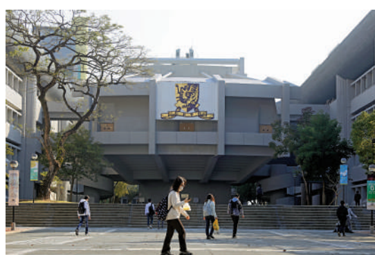
▲中文大學的文化管理文學士課程，重視跨學科學習，以求培育新一代文化領袖和文化中介者。

有意報讀該專業的學生，中文、英文、數學和通識的成績需達到3分、3分、2分、2分，兩門選修科需達到3分。