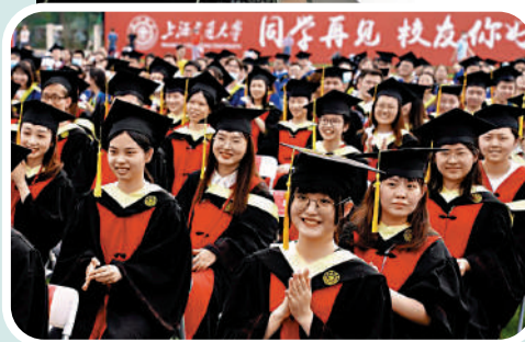
▲上海交通大學文化產業管理專業，旨在培育管理和實踐能力兼備的複合型人才。