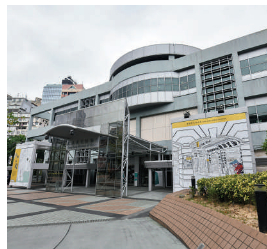
▲香港歷史博物館由康樂及文化事務署管理。

很多人都會希望加入政府部門做公務員，因為是「鐵飯碗」，而且人工普遍不錯，還可以逐年跳薪級，所以是畢業生的熱門選擇。香港的博物館由康樂及文化事務署管理，主要有香港歷史博物館和香港文化博物館。現時二級助理館長為總薪級表第14至27點（30235元至55995元）；一級助理館長為總薪級表第28至33點（58635元至73775元）。