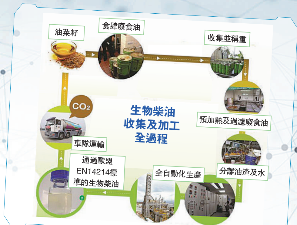
生物柴油優點多(部分)