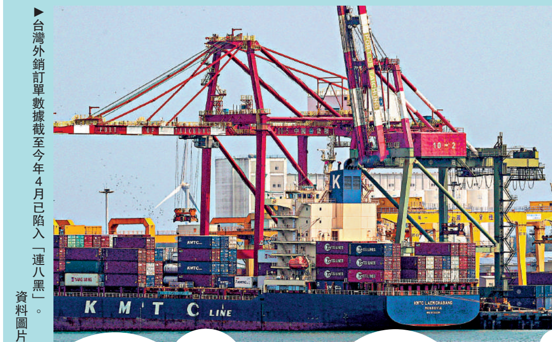
台灣外銷訂單數據截至今年4月已陷入「連八黑」。資料圖片

外交部發言人毛寧2日在記者會上應詢時表示，中方堅決反對建交國與中國台灣地區進行任何形式的官方往來，包括商簽任何具有主權意涵和官方性質的協定。美官方執意與台民進黨當局推銷所謂「21世紀貿易倡議」談判，執意簽署有關協議，嚴重違反一個中國原則和中美三個聯合公報規定，嚴重違背美方做出的僅與台保持非官方關係的承諾。「中方對此強烈不滿，已向美方提出嚴正交涉。」