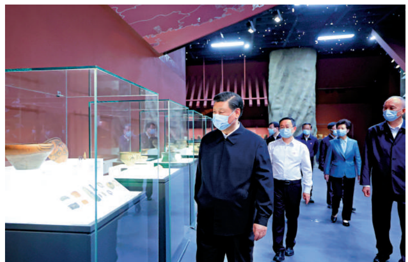
6月2日，習近平在北京出席文化傳承發展座談會並發表重要講話。這是座談會前，習近平2日下午在中國歷史研究院考察。

●從根本上決定了中國始終是世界和平的建設者、全球發展的貢獻者、國際秩序的維護者，決定了中國不斷追求文明交流互鑒而不搞文化霸權，決定了中國不會把自己的價值觀念與政治體制強加於人，決定了中國堅持合作、不搞對抗，決不搞「黨同伐異」的小圈子。