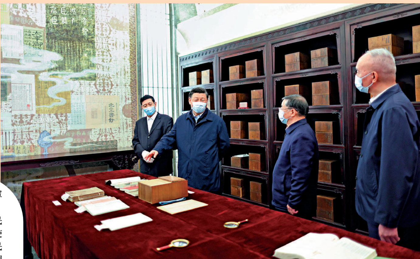
6月2日，中共中央總書記、國家主席、中央軍委主席習近平在北京出席文化傳承發展座談會並發表重要講話。這是座談會前，習近平1日下午在中國國家版本館考察時，在蘭台洞庫了解館藏精品版本保存情況。

【大公報訊】據新華社報道：中共中央總書記、國家主席、中央軍委主席習近平6月2日在北京出席文化傳承發展座談會並發表重要講話。他強調，在新的起點上繼續推動文化繁榮、建設文化強國、建設中華民族現代文明，是我們在新时代新的文化使命。要堅定文化自信、擔當使命、奮發有為，共同努力創造屬於我們這個時代的新文化，建設中華民族現代文明。中華文明具有突出的統一性，決定了國家統一永遠是中國核心利益的核心，決定了一個堅強統一的國家是各族人民的命運所繫。為開好這次座談會，習近平考察了中國國家版本館和中國歷史研究院。