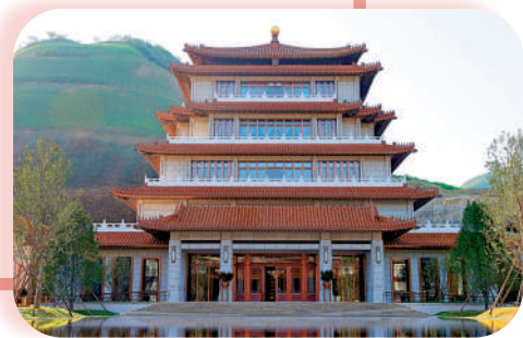
位於北京城中軸線北延長線上的中國國家版本館中央總館文瀾閣外景。

印記的各類資源。這裏面有承載厚重歷史文化的古籍、青銅器，也有包含着鮮明時代印記的糧票、布票，和我們日常生活息息相關的圖書、報刊、磁帶等，總之，只要你能想到的文化的載體，基本都算是版本資源。