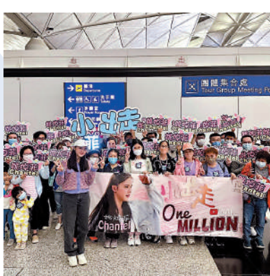
▲姚焯菲（前）在香港有不少粉絲。