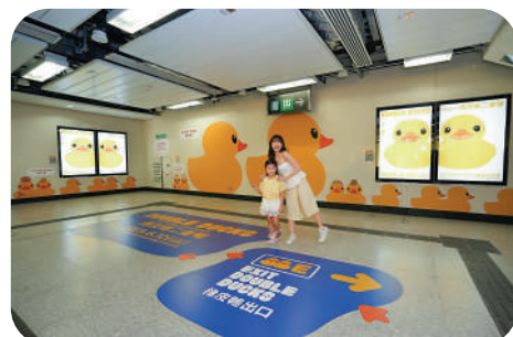
▲其中一個打卡位：月台地面貼紙。