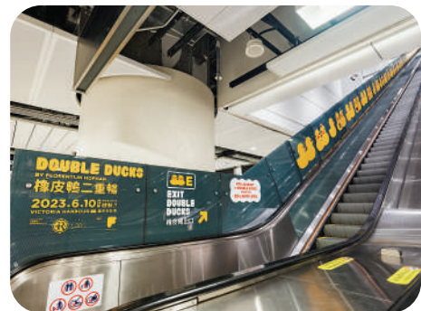
▲扶手電梯的黃鴨元素。

走進港鐵金鐘站，可以看到站內的各個角落都佈滿黃色橡皮鴨主題裝飾。在月台、樓梯、扶手電梯、牆壁等位置，有關方面根據空間而設計出大如整隻橡皮鴨，小如腳印、水滴等元素，讓乘客置身在巨型黃色橡皮鴨歡樂氛圍中。而E出口處的半圓玻璃天窗已化身為可愛的鴨子臉，亦成為港鐵最大規模的戶外公共藝術裝置。不少乘坐港鐵的市民，會在扶梯處拿出手機拍攝天窗上的黃鴨。