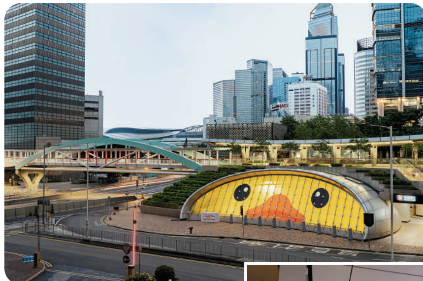
▲港鐵金鐘站E出口的半圓玻璃天窗，已化身可愛的鴨子臉。

此外，一套由24款組成的「《橡皮鴨二重唱》遊香港特色」的全新造型系列陸續推出，該系列結合香港各區的歷史、地標、文化風俗及社會特色。其中，第一批已出現在18個不同的港鐵車站，第二批香港特色系列將於6月12日