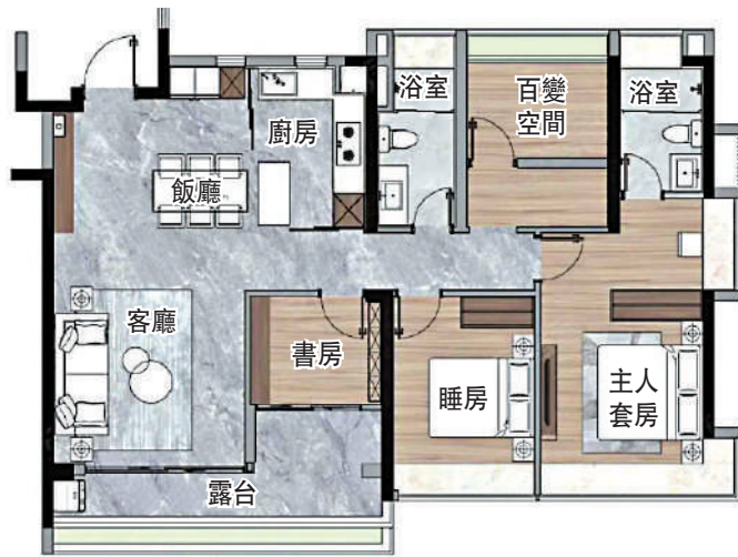
▲保利·錦上印126平米四房兩廳戶型圖。