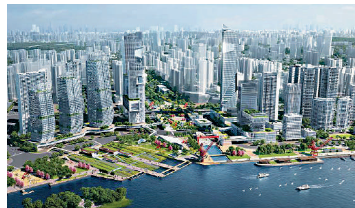
▲濱江上都建築面積125萬平米，屬大型商住綜合項目。