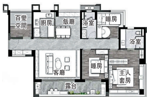
▲萬匯天地·臻園141平米四房兩廳戶型圖。