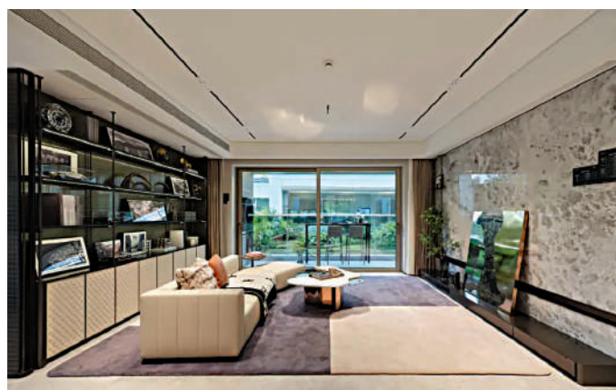
▲萬匯天地·臻園首推單位面積介乎110至141平米。