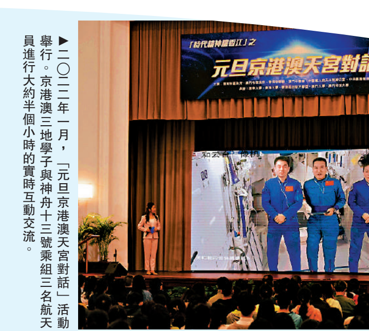
▲二〇二二年一月，元旦京港澳天宮對話活動舉行。京港澳三地電子與神丹十三號乘組三名航天员進行大約半小時的實時互動交流。