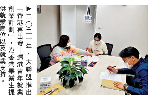
▲二〇二二年，大聯盟推出創業計劃，為香港青年提供就業崗位及就業支持。

2020年10月，大聯盟舉辦香港各界青年座談會，學習習近平總書記在深圳經濟特區成立40周年慶祝大會上的重要講話。全國青聯副主席霍啟剛、梁宏正，以及香港各主要青年團體負責人、各界青