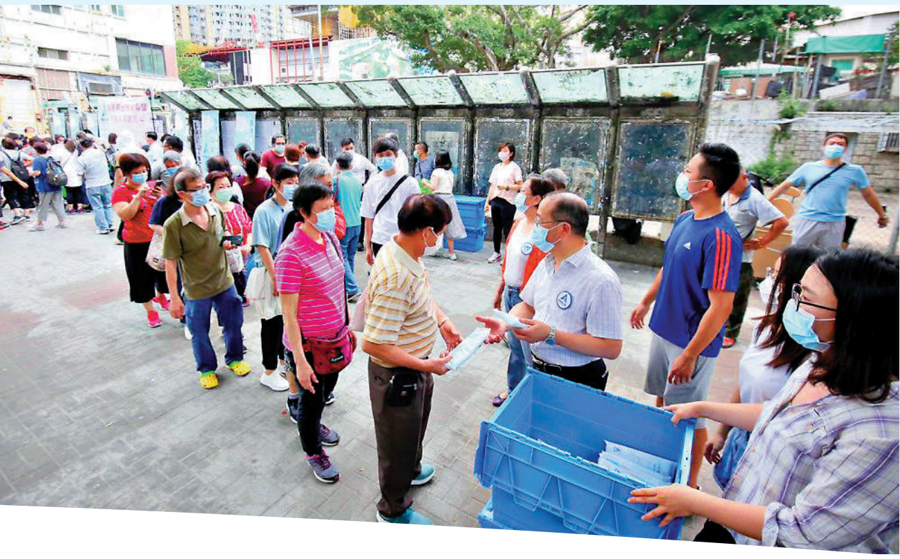
▲「再出發」大聯盟日前在會展舉行，全國政協副主席、香港再出發大聯盟召集人梁振英，行政長官李家超，中聯辦主任鄭雁雄，大聯盟秘書長譚耀宗等出席並致辭。