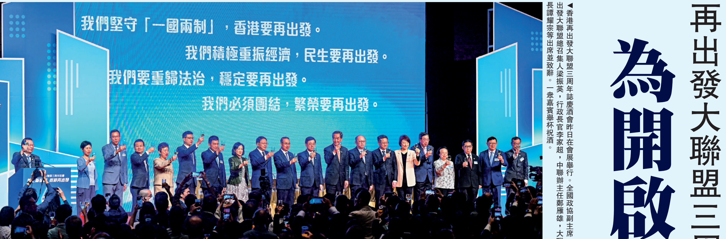
▲香港再出發大聯盟三周年誌慶會昨日在會展舉行，全國政協副主席、香港再出發大聯盟召集人梁振英，行政長官李家超，中聯辦主任鄭雁雄，大聯盟秘書長譚耀宗等出席並致辭。