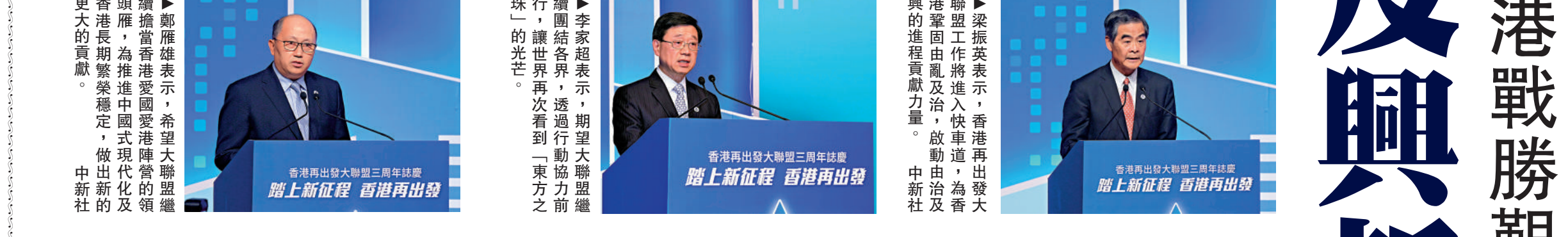
▲香港再出發大聯盟三周年誌慶會昨日在會展舉行，全國政協副主席、香港再出發大聯盟召集人梁振英，行政長官李家超，中聯辦主任鄭雁雄，香港再出發大聯盟秘書長譚耀宗等出席活動並致辭。中央駐港國安公署副署長李江舟，外交部駐港公署特派員劉光源，香港特區立法會主席梁君彥，香港特區行政會議非官守議員召集人葉劉淑儀等主禮嘉賓，與大聯盟部分共同發起人，以及香港社會各界人士700餘人出席了活動。

大聯盟昨日在香港會展中心舉行「踏上新征程 香港再出發」成立三周年誌慶。新征程上，大聯盟將繼續為香港鞏固亂到治、開政由治及興進程貢獻力量。