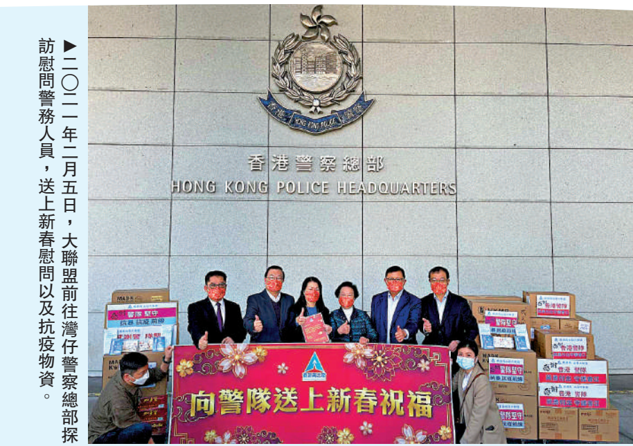
▲二〇二二年二月五日，大聯盟前往灣仔警隊總部探訪慰問警隊人員，送上新春問候以及抗疫物資。