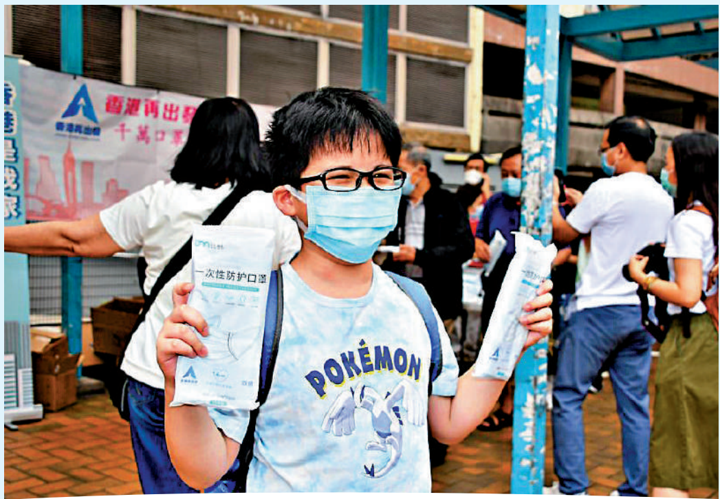
▲疫情期間，再出發大聯盟舉辦「千萬口罩獻愛心」活動，設立四百五十個街站，向全港社區及五百二十間小學派發口罩。