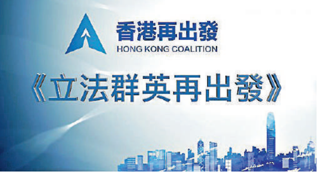
▲二〇二二年，完善選制後首屆立法會正式投入運作，大聯盟製作一輯全新節目，記錄新一屆立法會及各議員，在「愛國者治港」實踐下再出發的點滴，呈現議會新氣象。

大聯盟開始製作一輯「立法群英再出發」的節目，專訪90位新一屆立法會議員。由2022年1月25日起，節目每周播放兩集，獲多間傳媒機構合作一同播出。