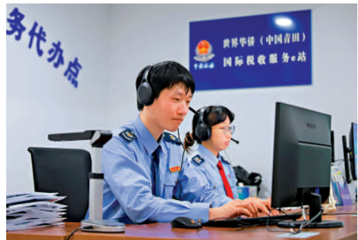
▲浙江青田「稅務e站」在線服務僑胞僑企。

浙江青田是中國著名的「華僑之鄉」，針對海外華僑跨國辦稅不便利的問題，青田縣依託「浙里辦」APP數智僑務系統，專門上線「稅務e站」專區，接入辦稅繳費渠道、稅費在線諮詢「雙接口」，為海外華僑代辦房產過戶繳稅和社保擔保繳費等高頻業務。