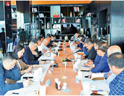
▲「政企午餐會」面對面解決企業困難。