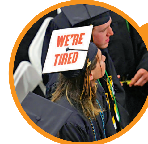
▲科羅拉多學院畢業典禮上，學生戴着「我們累了」的牌子。

的最大吸引力之一是相對較低的入學成本。根據美國大學理事會的數據，社區大學的平均費用約為四年制公立大學的三分之一。許多社區大學會與四年制大學簽訂轉學協議，允許學生在社區大學就讀兩年後，轉入四年制大學，學生可以直接從大三讀起，意味著只需支付兩年的高額學費。