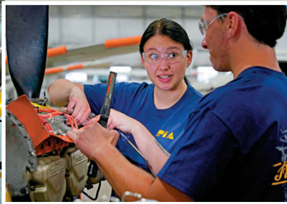
▲▲美國技術工人短缺，圖為航空學院的學生在研究飛機發動機。