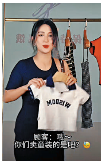
▲博主拍視頻諷刺小碼女裝大行其道，好似童裝。

在某社交平台上，「無性別穿搭」筆記高達45w+瀏覽，不少博主紛紛种草中性風寶藏店鋪。「比起被「美」束縛，舒適與自由更重要。取悅自己是一種高級的時尚。」