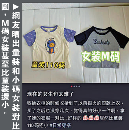
圖：網友晒出童裝和小碼女裝對比，M碼女裝甚至比童裝還小。