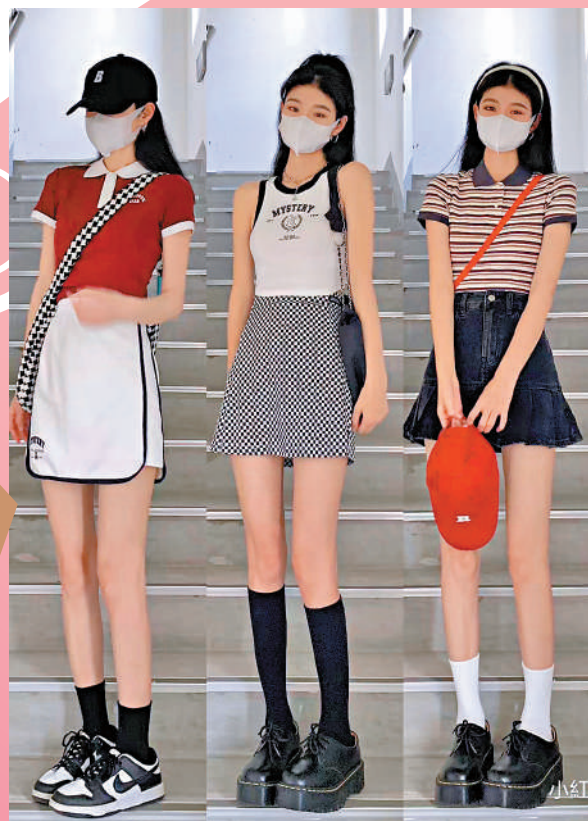
▲在「A4腰」「漫畫腿」營銷下，「紙片人」身材受追捧，這種趨勢下，小碼衣服成為眾多品牌賣點。圖為一博主晒出自己小碼女裝穿搭。