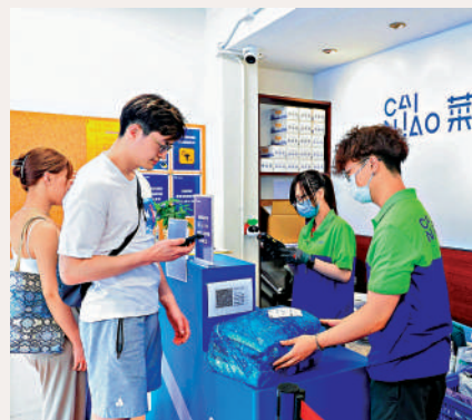
▲菜鳥集運針對香港用戶，發放逾700萬元物流紅包。

小米之家方面，銷售額按年增長55%，手機銷量升27%，智能生活產品銷量升38%。