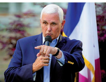
▲彭斯5日遞交參加2024年總統選舉的申請文件，挑戰特朗普。

是「一個基督徒，一個保守派和一個共和黨人」。2016年，他被選為特朗普的競選搭檔，主要原因之一便是他能夠幫助特朗普鞏固保守派選民的支持。