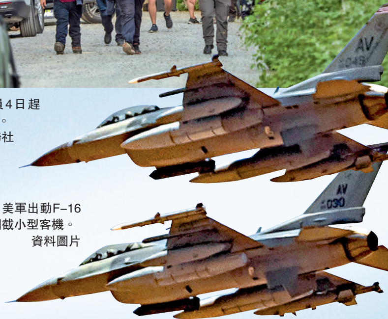
▶美軍出動F-16攔截小型客機。資料圖片