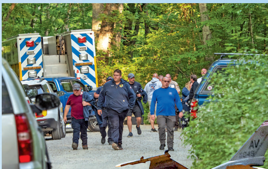
▲搜救人員4日趕往墜機現場。