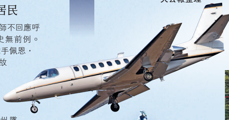
▲一架小型客機4日闖入華盛頓禁飛區，隨後墜毀。