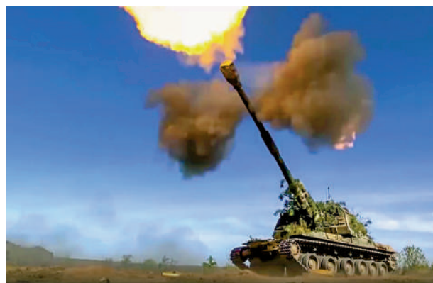
▲俄國防部5日公布俄軍向烏軍陣地開炮的照片。

【大公報訊】綜合CNN、今日俄羅斯報道：俄羅斯國防部5日凌晨通報稱，烏克蘭軍隊4日在頓巴斯前線的5個地區向俄軍發動大規模進攻，被俄軍擊退。烏軍因此損失了300名士兵和大量裝備。烏方未直接回應俄方聲明，並於4日發布視頻暗示烏軍即將發動反攻，但不會直接宣布反攻何時開始。