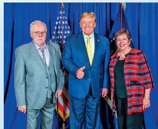
▲魯姆佩爾夫婦是特朗普（中）的支持者。網絡圖片