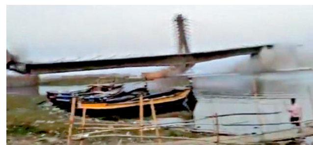
▲整個橋面筆直墜入河中。

另外，印度首都的一座政府辦公大樓5日發生火災，樓中有多個政府部門，包括外交部、財政部和內政部。《印度時報》援引德里消防局的消息称，有多達6輛消防車趕往現場。消防部門官員稱，該建築物中的服務器機房發生了火災，火情現已得到控制，目前沒有傷亡報告。