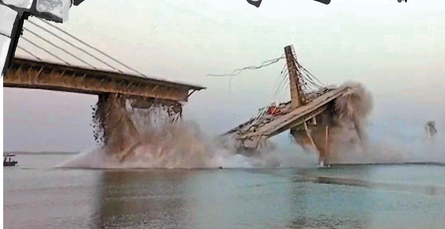
▲4日，橫跨恆河的阿格瓦尼—蘇丹甘吉大橋倒塌。