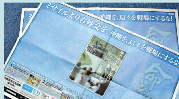
▲市民團體在報紙上登廣告，表示「外交比應對導彈更重要」。