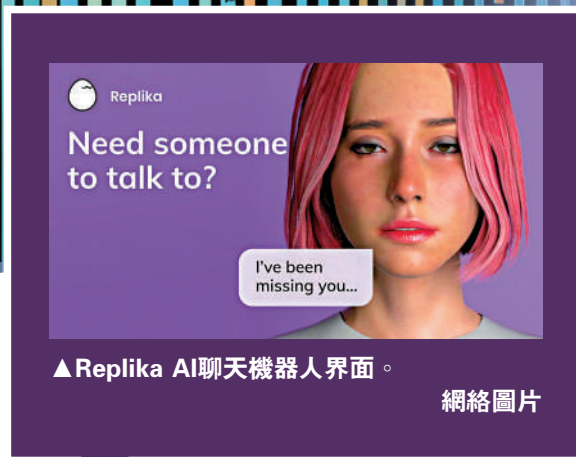
▲ Replika AI聊天機器人界面。網絡圖片