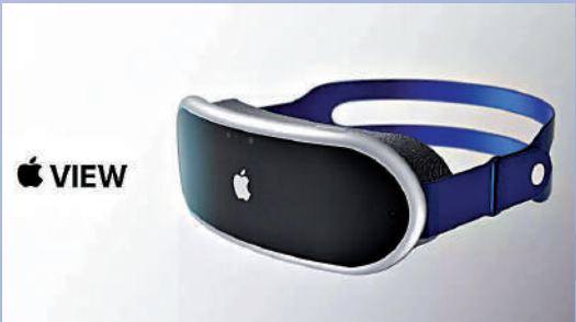
▲蘋果MR頭戴裝置概念示意圖。

在VR和AR界去年穩坐龍頭的Meta本月1日搶先公布旗下第三代頭戴裝置Quest 3，比前一代更輕、性能更強，創造更貼近真實的虛擬體驗，預計9月公開完整細節。