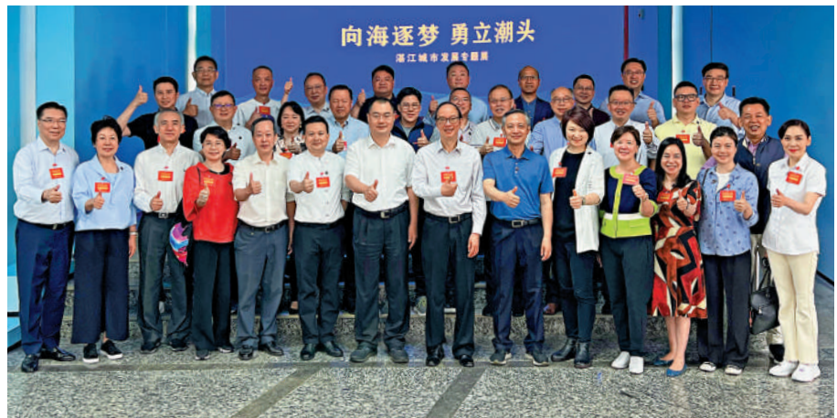
▲香港特別行政區第十四屆全國人大代表赴粵專題調研組一行5日上午在湛江調研，圖為調研組在湛江規劃館內合照。

香港第七屆立法會議員、全國青聯副主席、霍英東集團副總裁霍啟剛直言這裏真正體現了「綠水青山就是金山銀山」的環保概念。他表示，一個被形容為生態「傷疤」的地方，通過環保發展理念和科技手段，發展成為一個融旅遊體育文娛於一體的生態公園，提升了周邊市民的幸福感，值得香港借鑒。