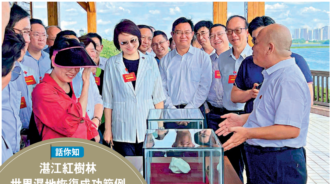
▲港區全國人大代表在廣東茂名露天礦生態公園查看露天礦礦石展示。

霍啟剛認為，香港要建設國際科技中心，環保產業和環保科技是其中一個重要內容，而粵西隨着重工業的投入與發展，對環保技術的需求相信會越來越大，香港與粵西之間有很大的合作空間。香港工商總會會長李聖潑也指出，香港本身有一些生態技術和大學研究的環保減排技術，還可以對接很多世界各地的先進技術，而內地市場龐大，如果香港能整合這些技術，也可以創造更好的合作機會。