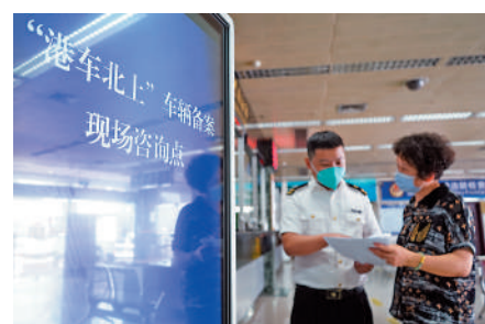
▲拱北海關所屬關口海關關員辦理「港車北上」車輛海關備案手續。

按照粵港兩地政府有關安排，符合條件的香港居民自6月1日起可向香港特區政府主管部門提交「港車北上」政策申辦申請，經香港及內地各相關部門審核及備案後，可自7月1日起經預約通關後，駕車經港珠澳大橋珠海公路口岸駛入廣東。拱北海關表示，海關將「港車