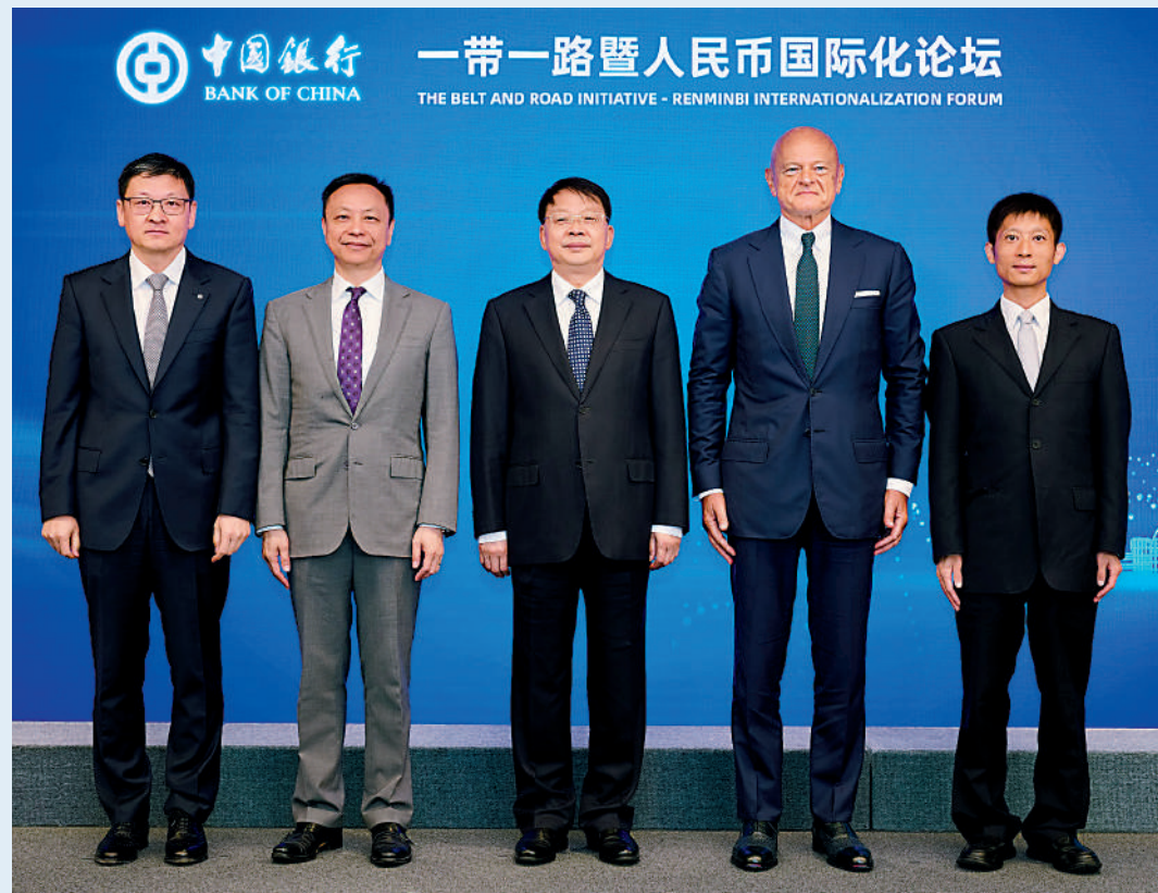
▲中聯辦副主任尹宗華(中)、匈牙利央行副行長帕泰·米哈伊(右二)、香港金管局副總裁陳維民(左二)、中聯辦經濟部副部長譚亞波(右一)及中銀香港副董事長兼總裁孫煜(左一)昨日出席論壇時合影。

人民幣國際化提速，目前已全球第五大支付貨幣、儲備貨幣及外匯交易貨幣。香港金管局副總裁陳維民表示，香港作為國際金融中心和離岸人民幣樞紐，在人民幣國際化和共建「一帶一路」的推進過程中，充分發揮自身優勢，支持跨境貿易結算、企業投融資等各類人民幣交易。金管局將繼續支持離岸人民幣市場發展，從三方面發力，包括增強流動性、豐富人民幣產品、優化金融基礎設施，提升香港離岸人民幣市場競爭力，加強各方溝通聯動，共同推進支持人民幣國際化進程。