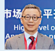
香港金發局行政總監 區景麟

未來伴隨人民幣在國際貿易結算、貸款和債券融資方面的重要性持續提升，人民幣國際化定將進一步有序推進