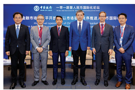
▲「中國金融市場高水平開放—以市場驅動有序推進人民幣國際化」分論壇與會嘉賓合影。

構化產品提供更多場外交易的可能，並通過更加透明的監管模式進行交易，加強與內地市場互聯互通，滿足不同企業在人民幣結算計價方面的需求。