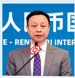
香港金管局副總裁 陳維民

隨着人民幣在國際市場受納程度提升，香港將獲得更多機遇，未來亦需完善流動性、產品及基礎設施，以維持領先地位