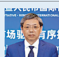
港交所董事總經理、首席中國經濟學家 巴曙松

未來五年，香港和內地將在金融科技不同的定位中形成互補，但是如何做到共同交流需要思考