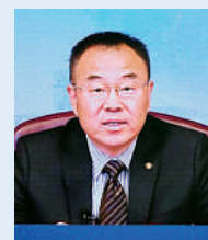
中國銀行行長 劉金

隨着人民幣在國際市場受納程度提升，香港將獲得更多機遇，未來亦需完善流動性、產品及基礎設施，以維持領先地位