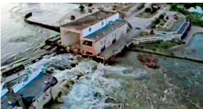
◀卡霍夫卡大壩被毀引發洪災，威脅下游數萬平民。

卡霍夫卡大壩高30米，長3.2公里，擁有一個18平方公里的水庫，蓄水約1800萬立方米，是克里米亞地區的主要供水來源，扎波羅熱核電站亦依靠大壩水庫供水，用於冷卻反應堆。克里米亞地方政府稱，通向水庫的北克里米亞運河水位將會下降，但目前水道裏儲有4000萬立方米的水，當局亦採取