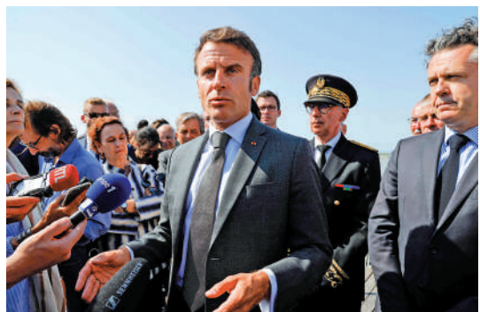
▲馬克龍近日表示，北約不應擴大到北大西洋以外。

汪文斌強調，大部分地區國家反對在地區拼湊各種軍事集團，不歡迎北約把觸角伸向亞洲，不接受把陣營對抗複製到亞洲，不允許任何冷戰熱戰在亞洲重演。北約在這個問題上應該保持頭腦清醒，日本也應做出符合地區穩定和發展利益的正確判斷。