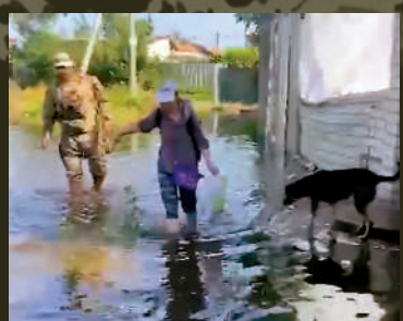
▲烏克蘭警察協助赫爾松地區居民撤離。