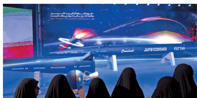
◀伊朗高超音速導彈「法塔赫」6日正式亮相。

伊朗上月成功測試了一款射程2000公里的新型彈道導彈，引起西方國家更多批評。西方稱，伊朗的彈道導彈可能被用於攜帶核彈頭，伊朗政府否認。