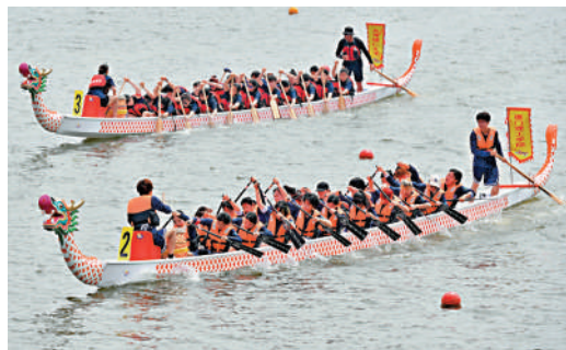
▲6月3日，來自海峽兩岸的龍舟隊在廈門龍舟賽200米直道賽中奮勇爭先。

國台辦發言人朱鳳蓮也曾針對陸委會行徑表示，台灣方面明令禁止台灣民眾來大陸團隊遊，是30多年來從未有過的；民進黨當局拒不解除禁令，只會損害台灣民眾和旅遊業界的利益，不得人心。