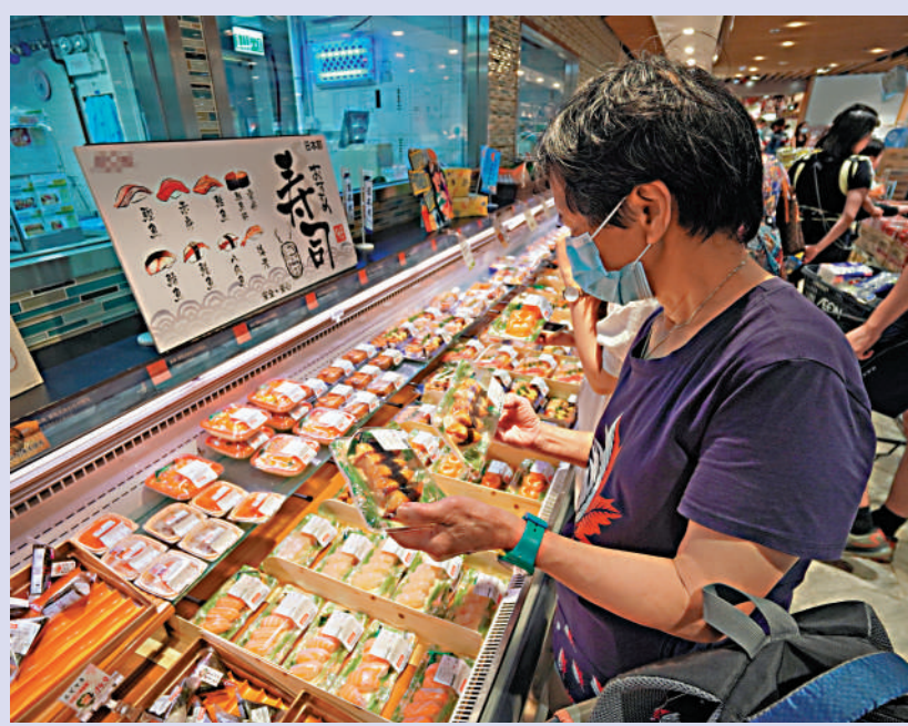
▲香港市民喜歡食用日本壽司海產，但核污水事件令人怕怕。