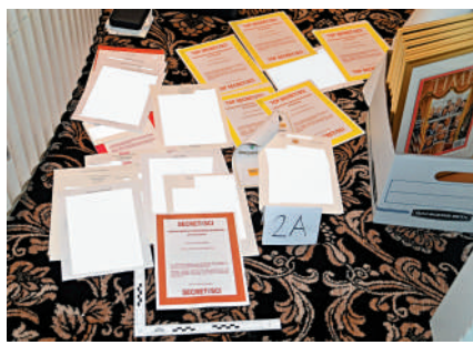
▲ FBI去年8月從海湖莊園查獲的部分涉密文件。

目前起訴書的具體內容尚未公布，但特朗普的律師透露，特朗普面臨7項罪名指控，包括間