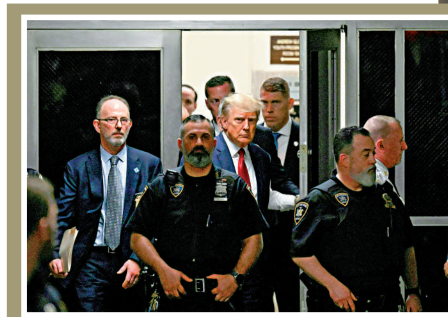
▲ 特朗普成為美國歷史上首位面臨聯邦刑事指控的前總統。

去年8月，FBI突擊搜查海湖莊園，查獲超過1.1萬份政府文件和照片，包括上百份涉密文件，其中54份為「秘密」、31份為「機密」、18份為最高級別的「絕密」。