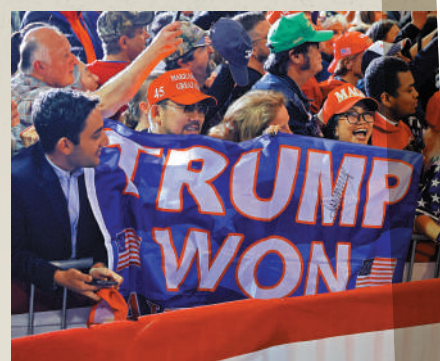
▲ 特朗普仍有大批堅定的支持者。

【大公報訊】綜合CNN、美聯社、《紐約時報》報道：美國司法部8日就「密件門」一案起訴前總統特朗普。特朗普繼成為美國史上首位面臨刑事起訴的前總統後，再次成為首位面臨聯邦刑事指控的前總統。他的律師透露，特朗普面臨間諜罪、作出虛假陳述和妨礙司法公正等7項罪名指控。另外，當地時間9日，特朗普的貼身助理諾塔也同樣因涉密文件案被起訴，特朗普團隊的兩名律師同日宣布辭職。