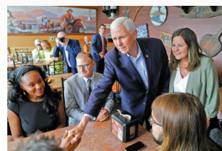
▲ 彭斯8日在艾奧瓦州一間披薩店和支持者交談。

配偶繼續就業的行政命令。CNN稱，拜登和其助手都認為，在相關問題上表態只會讓特朗普聲稱自己「遭受政治迫害」的「受害者」形象更深入人心。民主黨戰略分析師阿克塞爾羅德表示，特朗普可能會將接下來的競選活動變成針對這些起訴的武器。