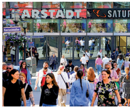
▲歐元區消費疲軟，圖為德國埃森的一條購物街。

根據上月底公布的數據，由於通脹高企令家庭消費收緊，歐元區最大的經濟體德國在今年第一季度陷入衰退。歐盟統計局表示，歐元區的政府支出、家庭消費、進出口在第一季度均有所下降。