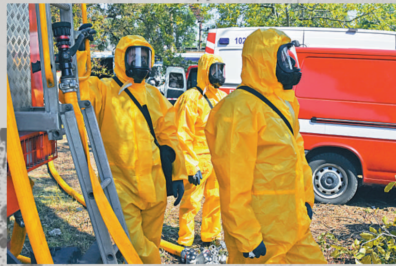
▲7日，烏工作人員身穿防護服在扎波羅熱參加培訓。