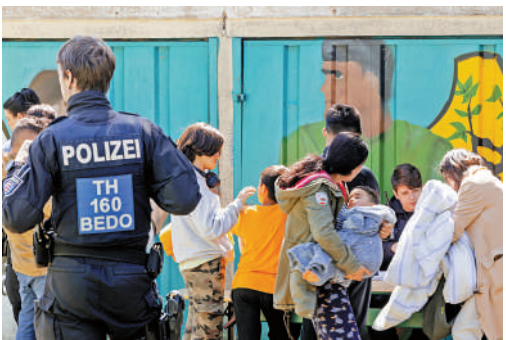
▲部分歐盟國對難民協議不滿，圖為德國難民收容所4日因火災疏散。

匈牙利內政部副部長雷特瓦里表示，歐盟此舉剝奪了成員國對於其自身領土的發言權，新的分配機制「允許非法移民或將他們帶到歐洲的人口販子自行決定誰能住在歐洲」。