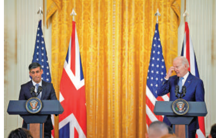
▲蘇納克（左）8日與拜登參加聯合發布會。

《大西洋宣言》還渲染「中國挑戰」，聲稱美英兩國面對中國等對全球穩定構成的新挑戰。對此，中國外交部發言人汪文斌9日回應說，國與國之間開展交流合作，應當有助於維護世界和地區的和平穩定，不應針對第三方或損害第三方利益。基於冷戰思維挑動陣營對抗，才是「全球穩定」的真正威脅。