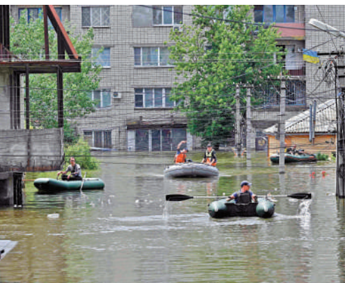
▲赫爾松民眾8日划船離開洪水氾濫地區。

各方對扎波羅熱地區的戰況說法不一。俄羅斯武裝部隊在扎波羅熱方向的集團軍指揮官羅曼丘克8日表示，烏克蘭軍隊未能在扎波羅熱方向實現突襲。他表示，烏軍機械化加強旅試圖在夜間向扎波羅熱方向發動反攻，俄羅斯軍事偵察隊、特種部隊和空中偵察發現了烏軍的行動，並進行火力反制。羅曼丘克稱，俄防空部隊擊落11架無人機，烏軍損失多達350人。烏克蘭武裝部隊9日則表示，烏軍對扎波羅熱進行空中轟炸，俄方「處於守勢」。