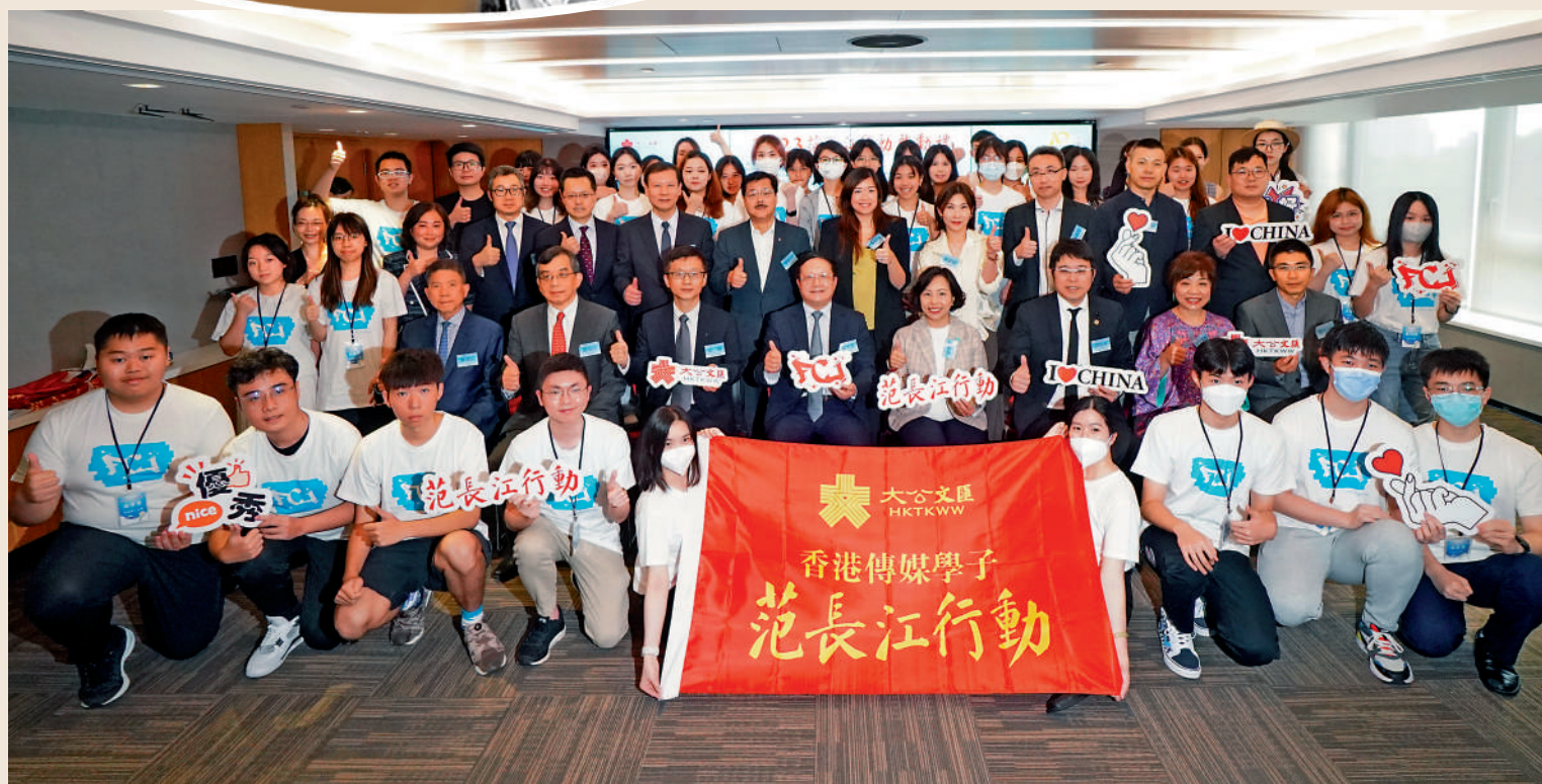
▲由香港大公文匯傳媒集團主辦的「2023范長江行動」昨日舉行啟動禮。