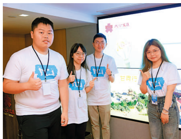
▲學生代表為啟動活動點讚。