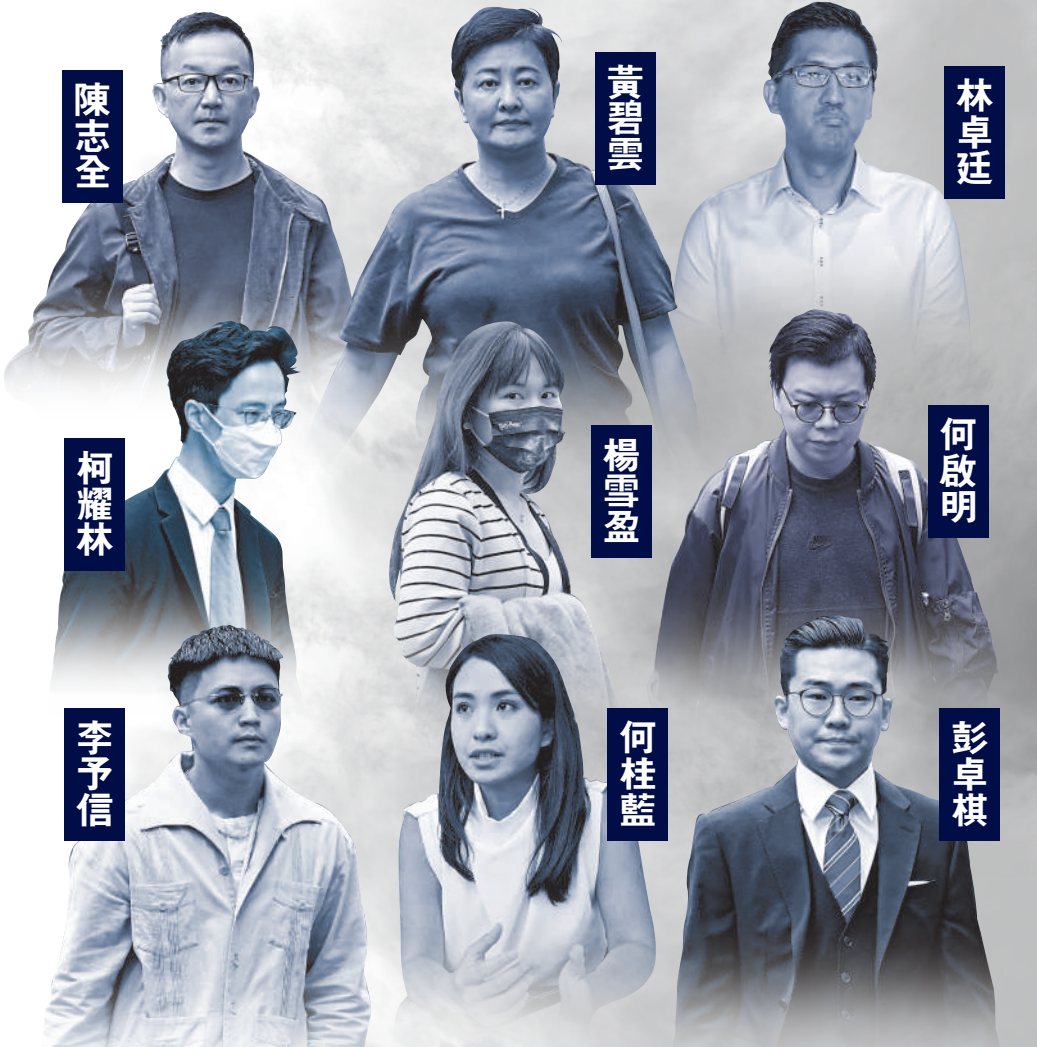
▲47人涉嫌策劃及組織參加所謂「35+初選」，被控干犯香港國安法當中的「串謀顛覆國家政權罪」，當中16名不認罪被告，昨被裁定表證成立。圖為部分被告。資料圖片

萬德豪續指「非法」概念含意廣闊，不止有刑事元素，亦包括違憲行為，而且立法會議員就任時必須宣誓，串謀者因此必然會干犯發假誓。法官最終拒絕4人的申請，並裁定所有16名不認罪的被告面對的控罪表證成立。