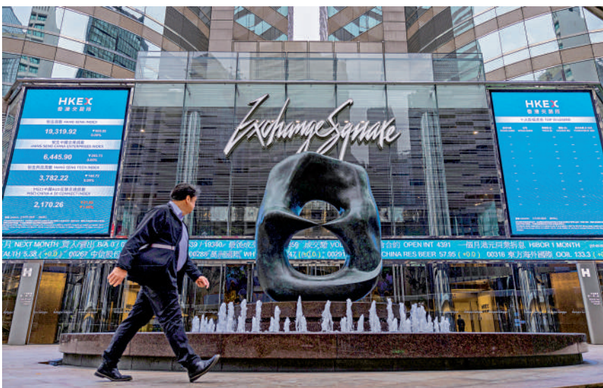
▲互聯互通等配套進一步完善，勢吸引更多投資基金、家族辦公室進駐香港。

同時，ETF通的投資產品數量將會增加，並探索房地產信託基金納入互聯互通機制的可能性。至於早前推出互換通，日均交易額30至40億元人民幣，隨着國際資金加碼投資人民幣債券，互換通交投量將顯著躍升。市場互聯互通等配套進一步完善，勢將吸引更多投資