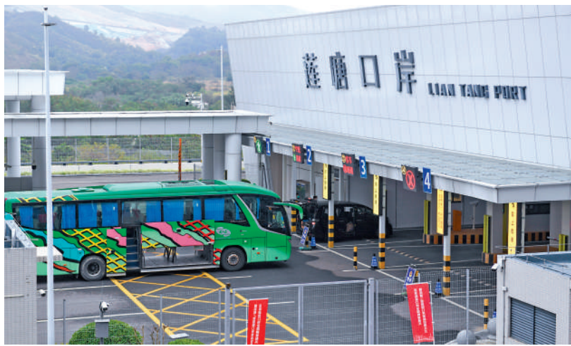
蓮塘口岸貨物和旅檢均採用「一站式」通關模式，效率大為提高。