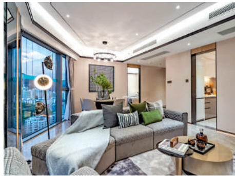
▲東海·富匯豪庭提供逾千個單位。