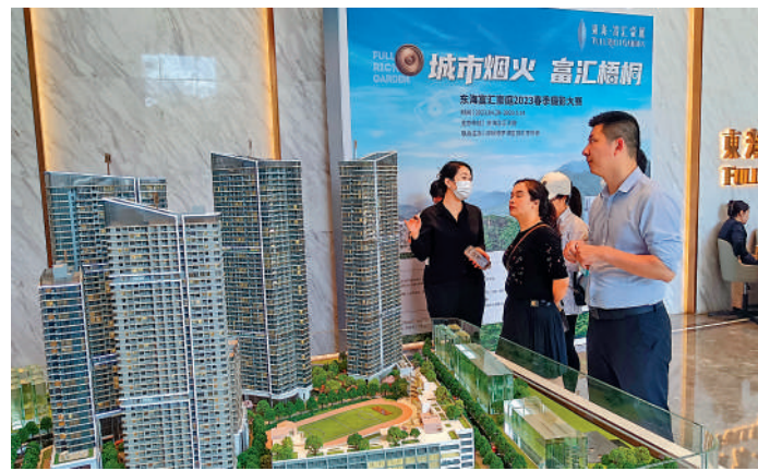
▲東海·富匯豪庭為蓮塘口岸少有的新盤，由5幢共6座建築物組成。