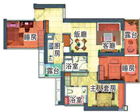
▲新世界·四季御園85平米三房兩廳戶型圖。