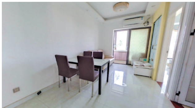
▲新世界·四季御園戶型多元化，滿足不同類型買家。

屋苑交通便利，距離地鐵2號線蓮塘口岸站僅380米，連通3號線和4號線等，前往羅湖、福田、南山、龍華等地十分方便，項目門口在蓮塘口岸公交站，出行便利。教育方面，周邊有安芳小學和羅湖外語學校等；商場方面有超級市場、餐飲食肆等。