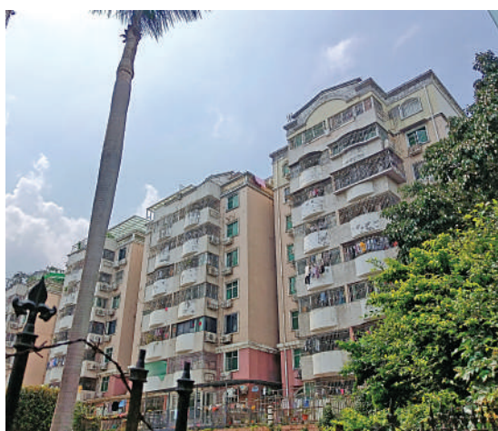
▲鵬興花園為大型社區，共分六期，總開發面積逾60萬平米。