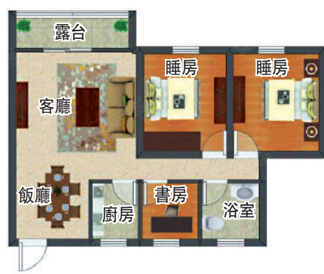
▲鵬興花園一期103平米三房兩廳戶型圖。