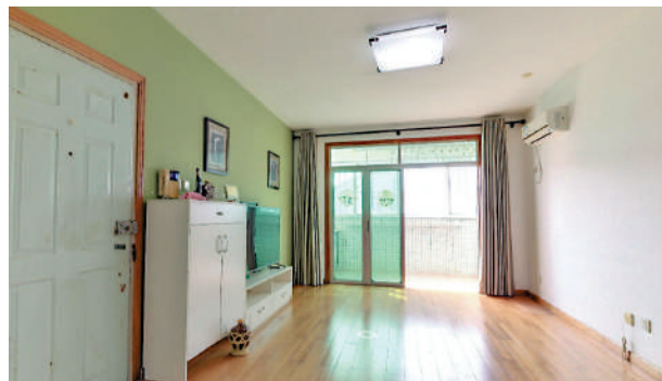
▲鵬興花園一期提供1343個單位，間隔實用。

屋苑距離地鐵2號線仙湖路站僅130米，蓮塘站約700米，交通十分方便，並配備大型超市，各種體育活動場所。5公里範圍內有新亞洲購物廣場、聚寶商業中心；超市有佳宜生活超市、千色百貨。教育方面，有鵬興實驗小學、羅湖外語學校；並有銀行、郵電所、醫院等生活設施。