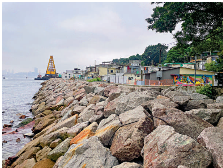
▲鯉魚門三家村靠海而建的房子。