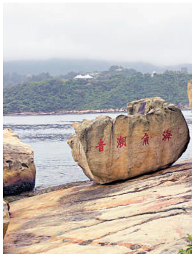
▲天后廟後靠海的「海角潮音」的四字巨石。