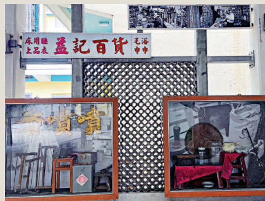
▲牛頭角下邨文化廊。