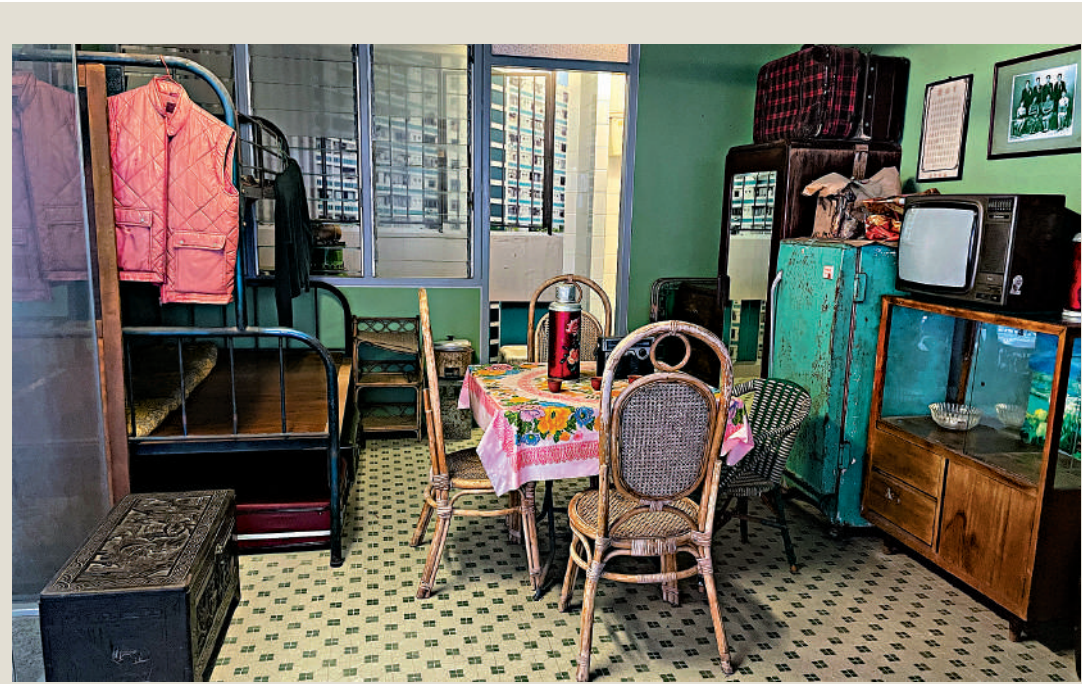
▲牛頭角下邨舊時公屋單位。