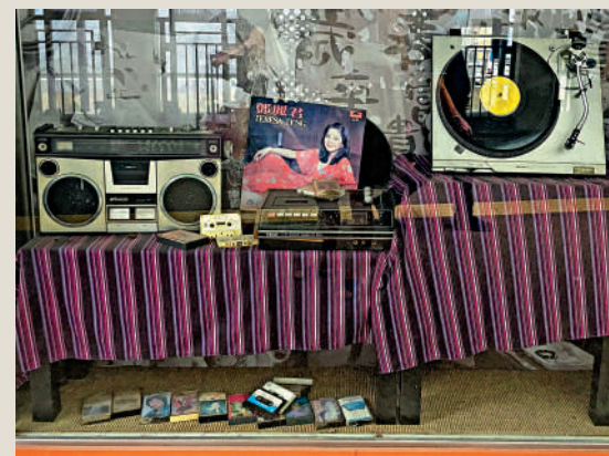
▲舊時鄧麗君黑膠唱片、黑膠唱機。