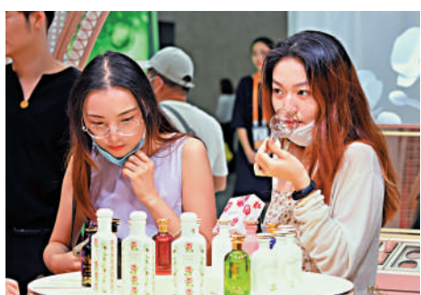
▲擴大內需是廣東未來推進高質量發展的重要舉措之一。圖為消費者在選購商品。

記者留意到，廣東在《新時代廣東高質量發展的若干意見》首次提出要建設高效順暢的現代流通體系。通過優化現代商貿體系，加快物聯網、人工智能等技術與商貿流通業態融合創新。「未來，隨著粵港澳大灣區更多重大合作平台的深入推進，廣東與香港、澳門的貿易往來將持續向好。」海關總署廣東分署二級巡視員袁勝強表示，廣東分署、省內海關將繼續加強與港澳海關的合作，深化規則銜接機制對接，加強監管互認，優化簡易通關模式，持續推進「跨境一鎖」「澳車北上」「港澳藥械通」等政策實施，全力支持大灣區人流、物流等資源要素跨境便捷流動。