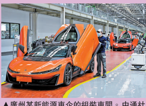
▲廣州某新能源車企的組裝車間。