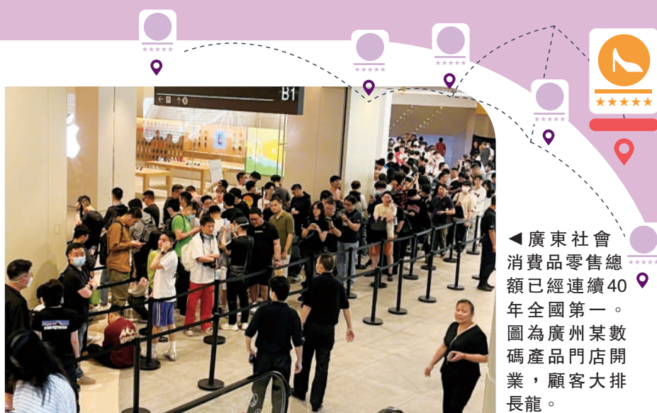
▲廣東社會消費品零售總額已經連續40年全國第一。圖為廣州某數碼產品門店開業，顧客大排長龍。

粵港澳三地市民「荷包」殷實，消費起來「毫不手軟」。去年，廣東社會消費品零售總額達4.5萬億元，已經連續40年全國第一；香港是全球聞名的「購物天堂」；而澳門依託豐富多元的旅遊業一直吸引着全球遊客……三地在各自優勢消費領域都是「單項冠軍」。