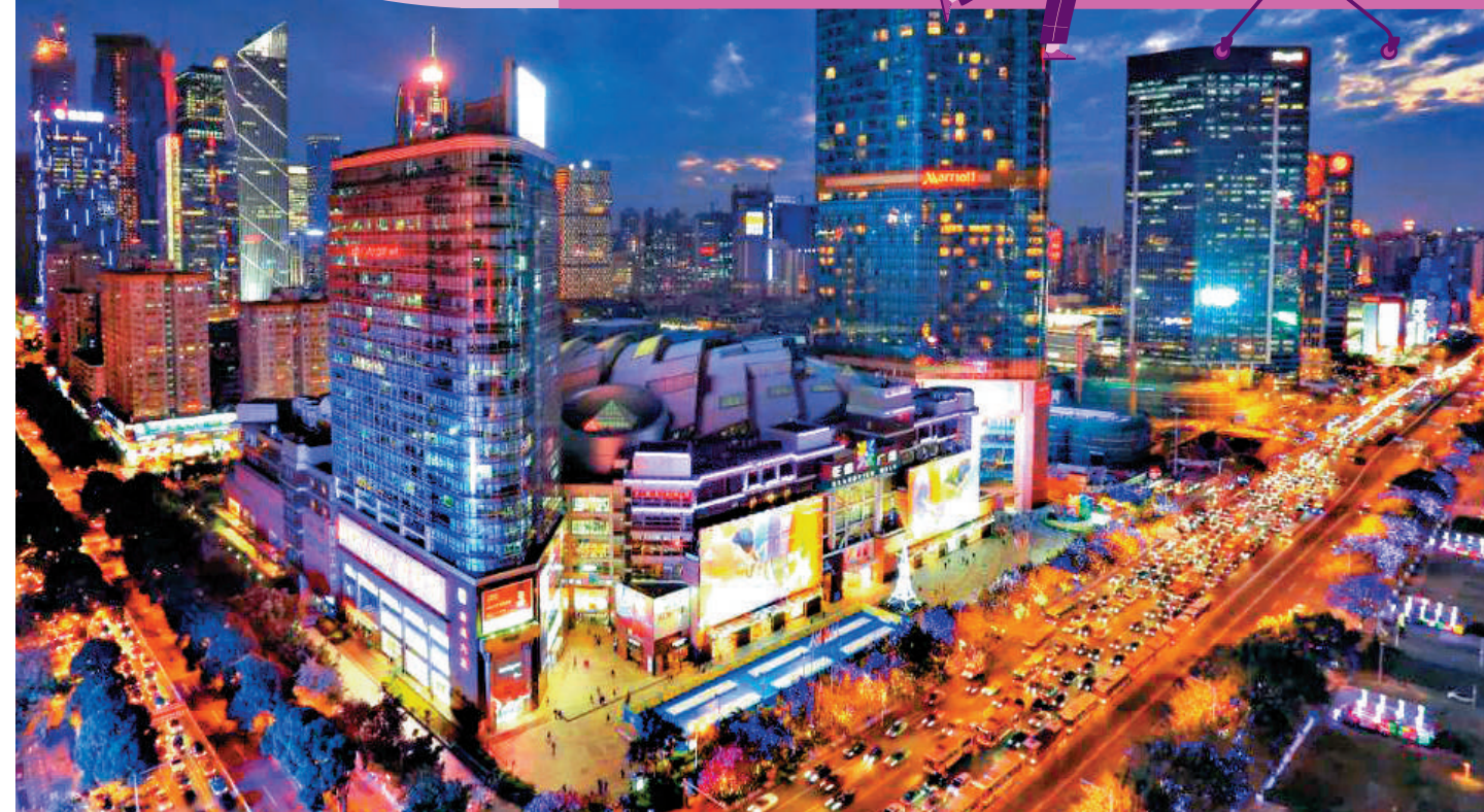
▲專家認為，應該謀劃建立「灣區大市場」，加快融入全國統一大市場。圖為廣州某商圈熱鬧非凡、車水馬龍。