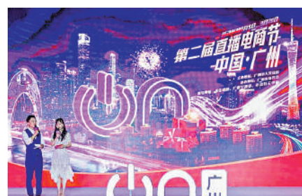
▲廣東舉行直播電商節，各直播電商平台、直播電商基地集聚一堂，面向全球促消費。

的潮流，也將工廠進行升級。「我們已經率先在廣州工廠開闢出品牌展銷門店，讓更多客戶可以認識自己品牌。另外線上渠道也少不了，我們也