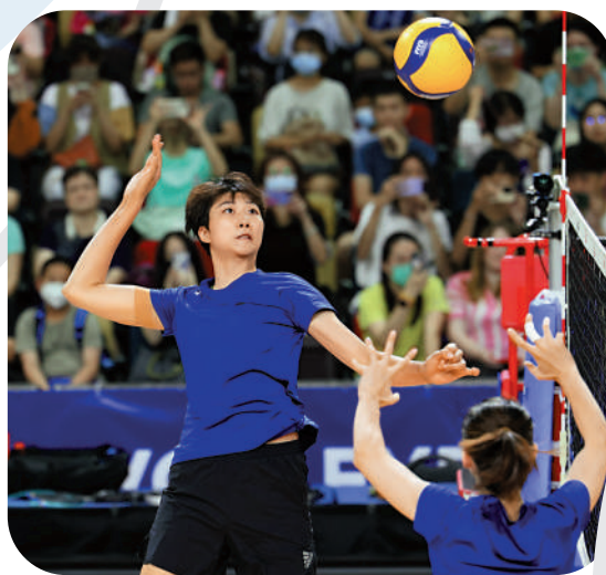
▲袁心玥（左）在訓練中扣球。