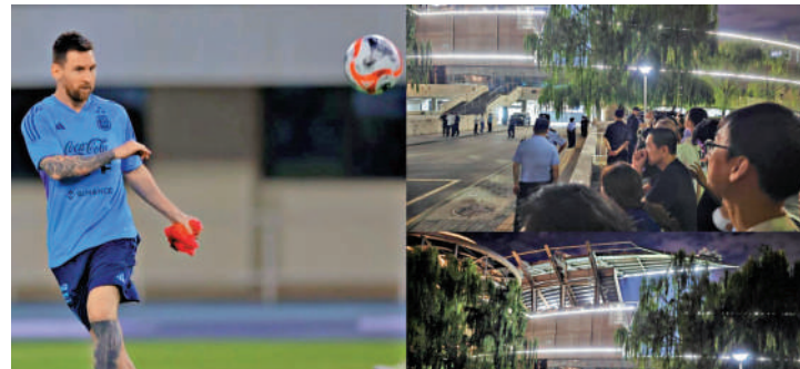
▲圖左為阿根廷球星美斯進行首課操練；圖右為大批球迷在奧體中心外等候一睹阿根廷球員風采。