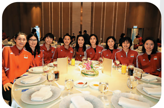
▲中國女排昨出席歡迎晚宴。