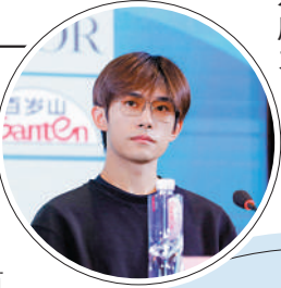
易焯千璽任「亞洲新人獎」評委

憑藉《落花流水》贏得認可的香港青年導演賈勝楓認為，香港電影題材可以本土化，但拍攝團隊不一定是故事發生地的人，敘事可以更多元化。他期待有機會結識更多內地的攝影指導、美術指導、服裝指導等。