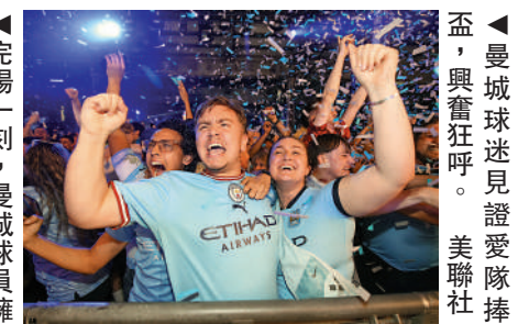
曼城球迷見證愛隊捧盃，興奮狂呼。