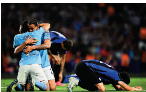
抱慶祝一刻，曼城球員擁伏地痛哭，對比強烈。