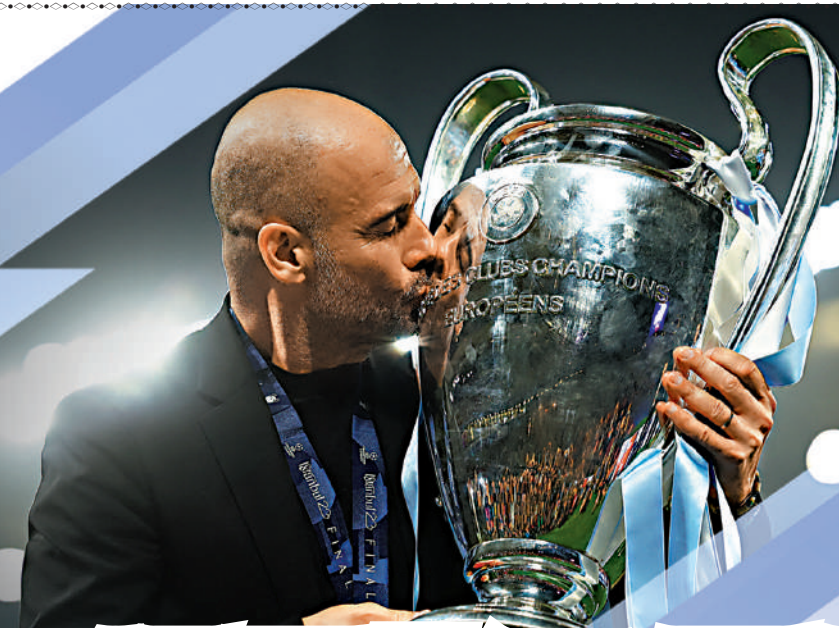
沒有美斯協助下，哥迪奧拿終於再奪歐聯，對他而言意義重大。