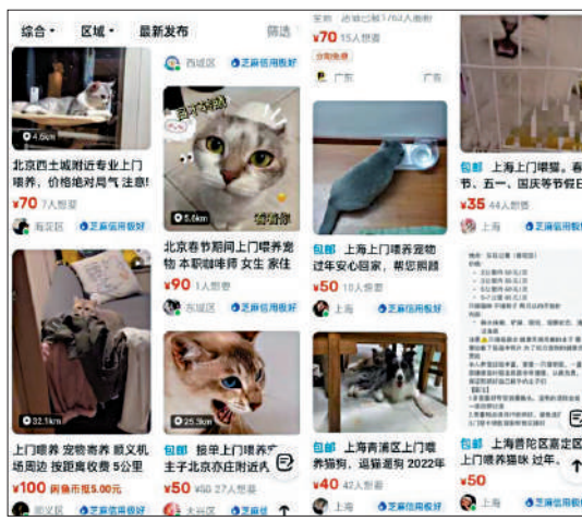
▲某二手交易平台上，不少人春節期間兼職「上門餵養」。