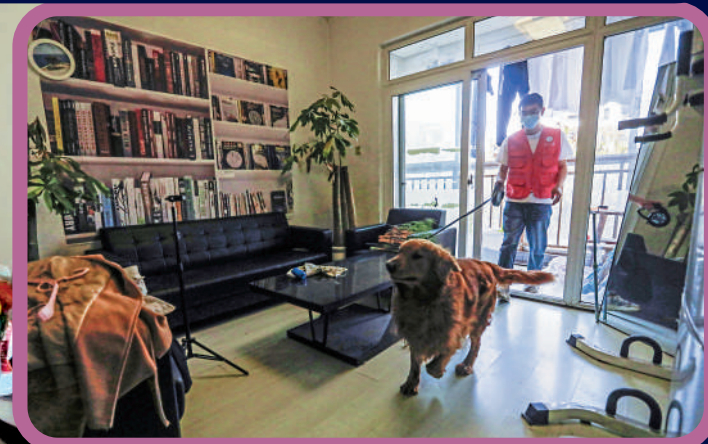
▲成都一位「寵託師」在客戶家裏準備去遛狗。