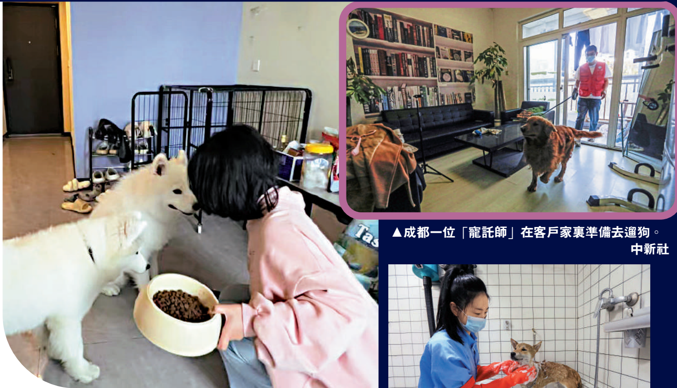
▲寵物託養師阿喵上門照顧客戶的寵物狗，她負責寵物上門餵養、寵物接送、代遛狗等服務。