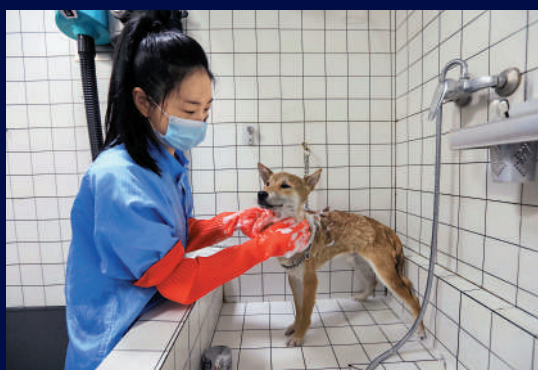
▶成都一社區寵物店的員工為寵物洗澡。