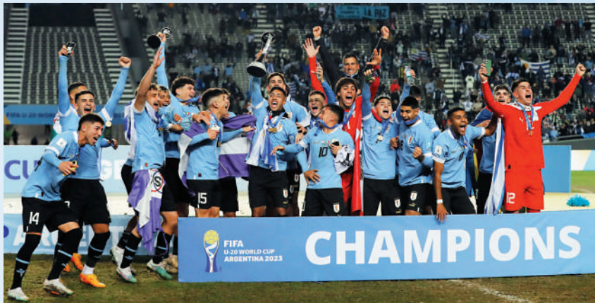
烏拉圭挫意大利贏得冠軍

出生日期: 2003年7月6日 (19歲) 國籍: 烏拉圭 身高: 1米93 位置: 中堅 球會: 華倫西亞 (西甲) 今屆世青盃表現: 7仗入0球、1助攻 主要榮譽: 世青盃冠軍