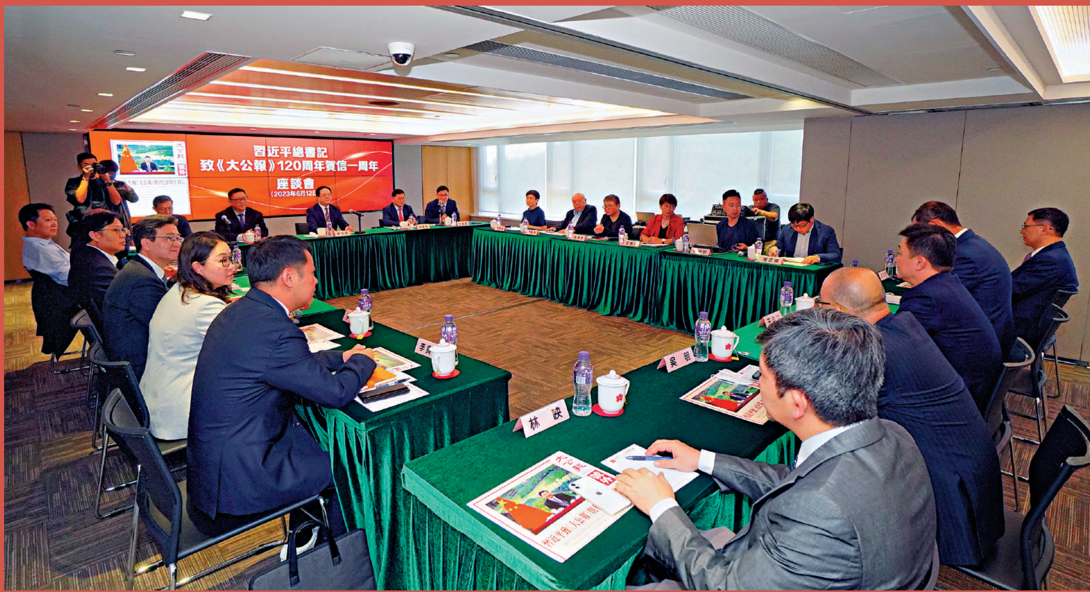
▲香港多個新聞團體代表昨日出席「習近平總書記致《大公報》120周年賀信一周年座談會」，大家熱烈討論。