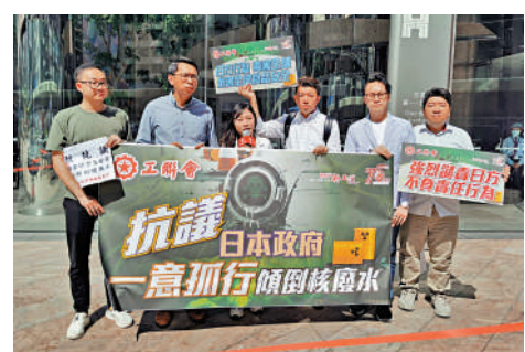
▲ 工聯會昨到日本駐港總領事館抗議日方計劃排放核污水。

【大公報訊】記者伍軒沛報導：日本計劃夏天起將福島污染水排入大海，工聯會昨日第三次到日本駐港總領事館所在的中環交易廣場外請願，譴責日本政府計劃排放核污水入海，批評危害全世界生態健康，行為自私，促請特區政府以鮮明立場表態，並採取強烈反制措施，阻止福島及附近多個縣的食品入口。有環保團體指，擔憂日本做法會助長其他地方將核污水一倒了之，帶來長遠累積影響。