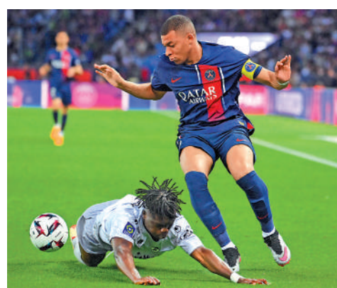
▲麥巴比(右)已表明下年滿約不續約。

並非在今夏，然而在賓施馬離隊後，皇馬突然又需要補充主力射手，在熱刺的哈利卡尼去向成疑下，重新投入轉會市場的麥巴比，或再成為皇馬的頭號目標。