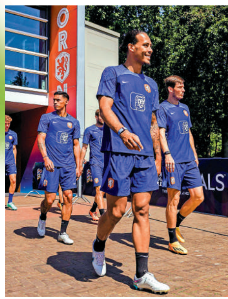
▲荷蘭已密鑼緊鼓操練，備戰對陣克羅地亞。