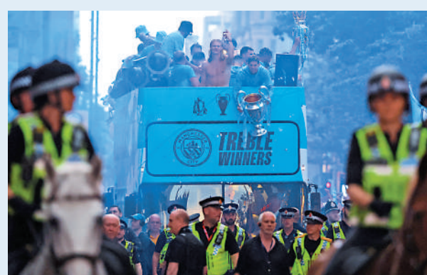
▲曼城成為「三冠王」後在當地舉行勝利巡遊。