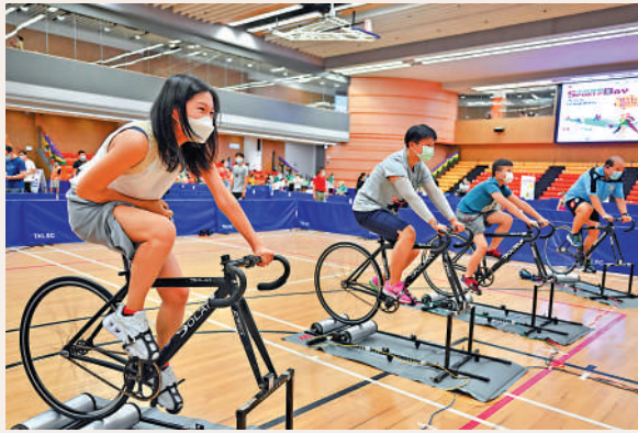
▲8月6日「全民運動日」，市民可以免費享用康文署轄下大部分康體設施。

兒童／青少年體育活動，以及適合長者及殘疾人士參與的運動示範和同樂活動。活動券於下月24日星期日上午8時半起，在康文署18區康樂事務辦事處和指定場地派發。