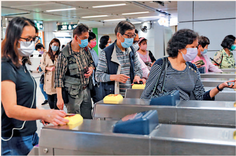
▲運輸局正與個別電子平台商討制訂方案，希望將更多電子支付系統納入「公共交通費用補貼計劃」。