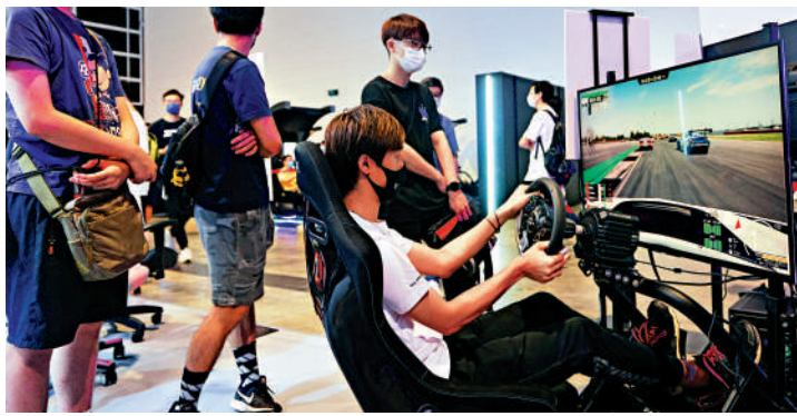
▲不少青少年喜歡打機，有關政府會否考慮推出措施防止青少年打機上癮。

暑假期間，不少學生選擇電子遊戲作為悠閒放鬆的一種方式。然而，世界衛生組織於2019年5月起，將電子遊戲上癮列為精神疾病，名為「電玩失調症（Gaming Disorder）」。 立法會選委會界別議員陳沛良昨日在會議上，關注政府會否考慮推出措施防止青少年打機上癮，例如規定須以實名註冊電子遊戲賬號、限制遊戲時間等，幫助青少年「脫癮」。 醫務衛生局局長盧寵茂回應說，打機