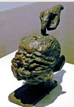
▶《坦白從寬》(創作時間不詳)