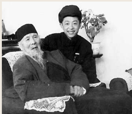
▲黃永玉與藝術大師齊白石合照。