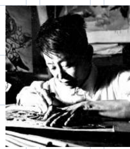
▲年輕時的黃永玉在創作版畫。

他是中國藝術領域「多面手」，國畫、版畫、雕塑樣樣精通；他被譽為藝術界的「鬼才」和「老頑童」，在創作中融會中西，繪出濃墨重彩的中國畫。同時，他也是中國第一枚生肖郵票「猴票」的創作者。他的藝術風格天馬行空，他的詩歌散文通透睿智、幽默深情……國寶級藝術家黃永玉13日逝世，享年九十九歲。「人死如遠遊，歸來再活人心上」，這句詩正如他與世間作別的結語，從此灑脫達達地雲遊天國。