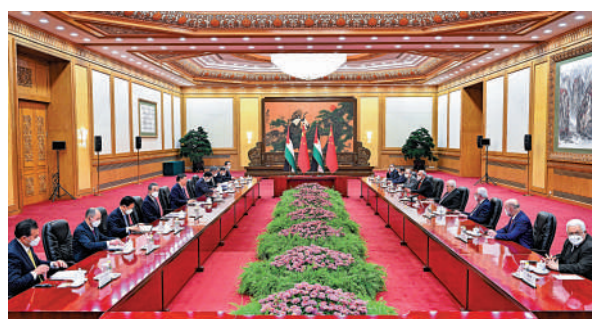
▲6月14日下午，國家主席習近平在北京人民大會堂同來華進行國事訪問的巴勒斯坦總統阿巴斯舉行會談。 新華社

聯合聲明強調，雙方將繼續在涉及彼此核心利益和重大關切問題上堅定相互支持。巴方堅定奉行一個中國原則，支持中國維護國家主權、統一和領土完整，堅決反對任何勢力干涉中國內政；重申中華人民共和國政府是代表全中國的唯一合法政府，台灣是中國領土不可分割的一部分，