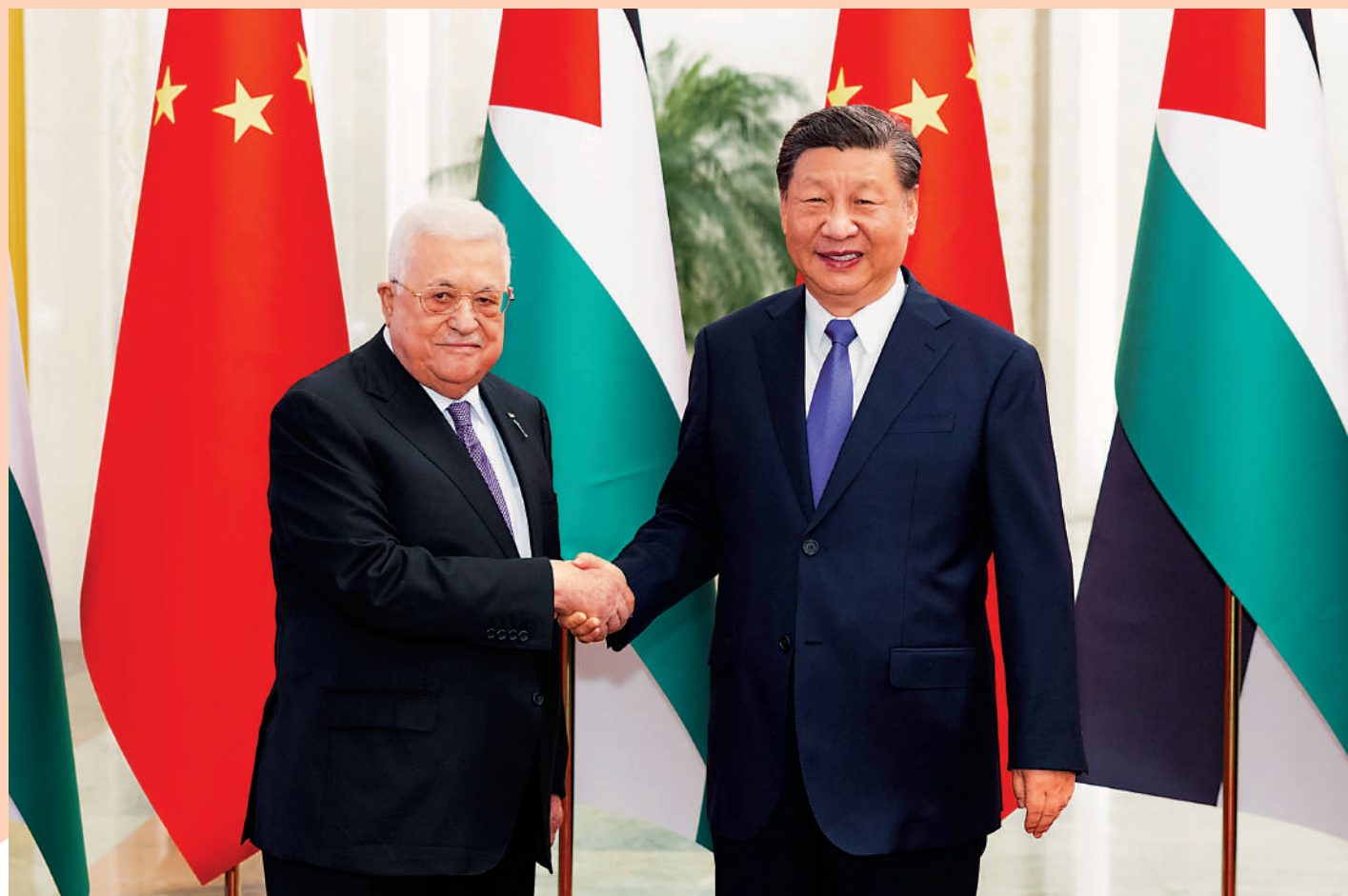
◀ 6月14日下午，國家主席習近平在北京人民大會堂同來華進行國事訪問的巴勒斯坦總統阿巴斯舉行會談。這是會談前，習近平在人民大會堂北大廳為阿巴斯舉行歡迎儀式。

【大公報訊】據新華社報道：6月14日下午，國家主席習近平在人民大會堂同來華進行國事訪問的巴勒斯坦總統阿巴斯舉行會談。兩國元首宣布建立中巴戰略夥伴關係。習近平指出，中方支持巴勒斯坦成為聯合國正式會員國，將繼續在多邊場合為巴方仗義執言、主持公道，願繼續向巴方提供力所能及的援助，幫助巴方緩解人道主義困難、開展重建。習近平強調，巴勒斯坦問題延宕半個多世紀，給巴勒斯坦人民帶來深重苦難，必須盡快還巴勒斯坦以公道。習近平強調，中方始終堅定支持巴勒斯坦人民恢復民族合法權利的正義事業，推動巴勒斯坦問題早日得到全面、公正、持久解決。習近平就解決巴勒斯坦問題提出三點主張。