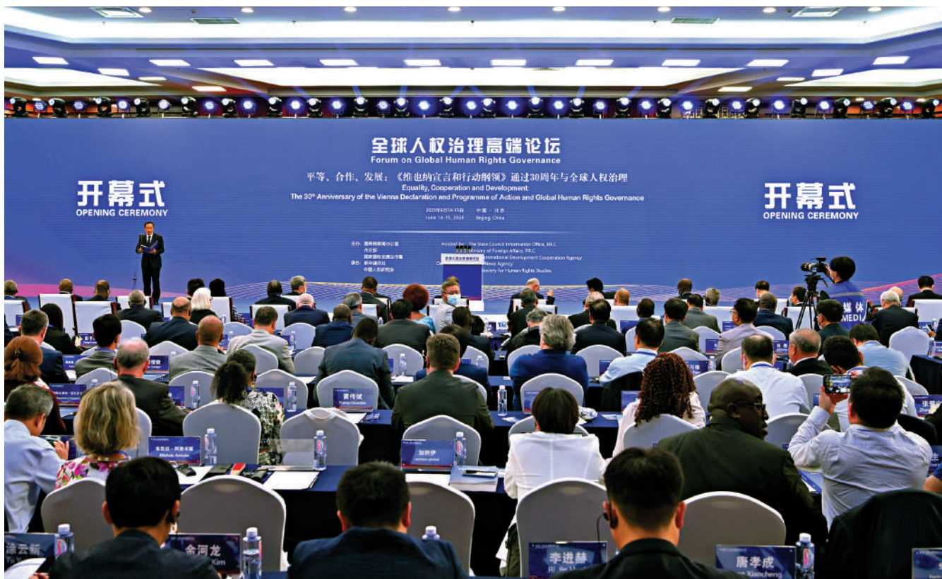
▲6月14日，全球人權治理高端論壇在北京舉辦，來自近百個國家和包括聯合國機構在內的國際組織的300餘位中外嘉賓，圍繞主題，積極交流，坦誠對話。

【大公報訊】據新華社報道：6月14日，中國國家主席習近平向全球人權治理高端論壇致賀信。習近平指出，當前，人類又一次站在歷史的十字路口，全球人權治理面臨嚴峻挑戰。我們主張以安全守護人權，尊重各國主權和領土完整，同走和平發展道路，踐行全球安全倡議，為實現人權創造安寧的環境；以發展促進人權，踐行全球發展倡議，提高發展的包容性、普惠性和可持續性，以各具特色的現代化之路保障各國人民公平享有人權；以合作推進人權，相互尊重，平等相待，踐行全球文明倡議，加強文明交流互鑒，通過對話凝聚共識，共同推動人權文明發展進步。