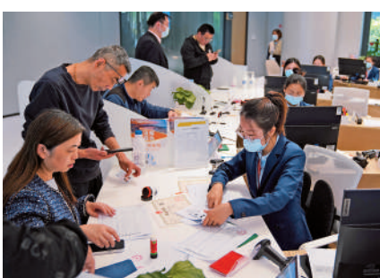
▲5月12日，市民在上海自貿區臨港新片區政務服務中心辦理業務。

在當天舉行的國務院政策例行吹風會上，袁達介紹，今年1月1日，中國新版《鼓勵外商投資產業目錄》正式施行，新增了239條鼓勵條目，新增條目達歷年來新高，鼓勵外商投資的行政