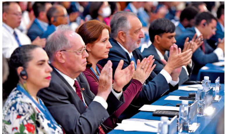
▶全球人權治理高端論壇開幕式現場。