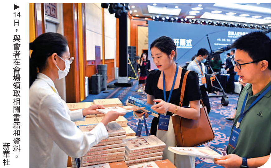
▶14日，與會者在會場領取相關書籍和資料。

他還指出，人權的實現需要一個有效政府，有效政府能夠為實現人權主動改善社會服務。「各國在實現人權方面都有一些很好的經驗，也有深刻的教訓，作為學術共同體，我覺得我們應當把各個文明、各個國家實現人權方面的最佳實踐總結好，促進更多的人能享受到更好的人權。」