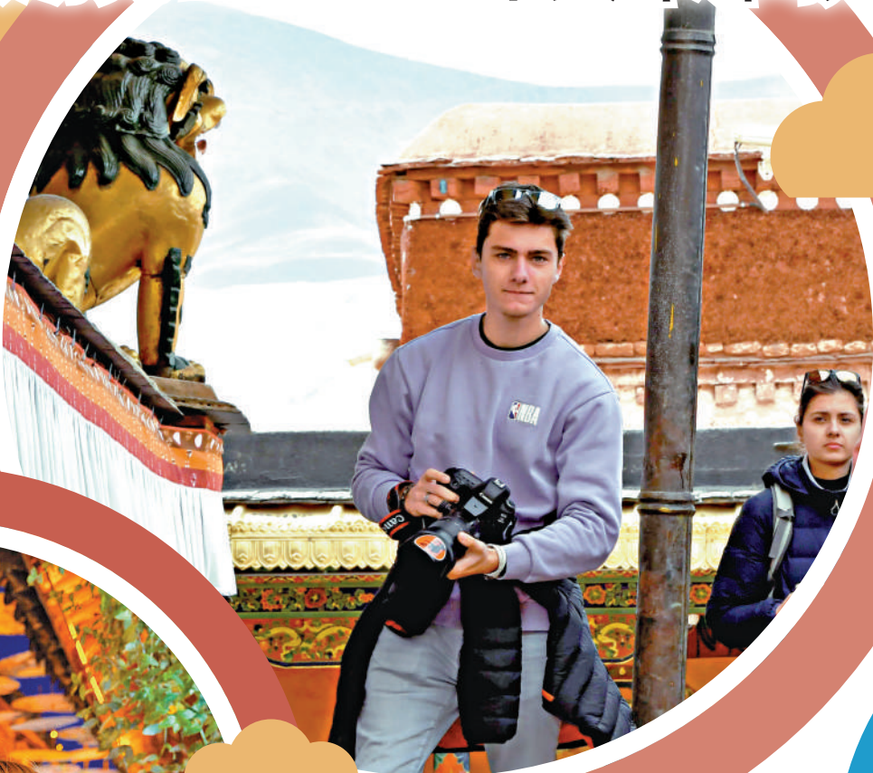
▲4月23日，一名外國遊客在位於西藏拉薩的大昭寺參觀遊覽。