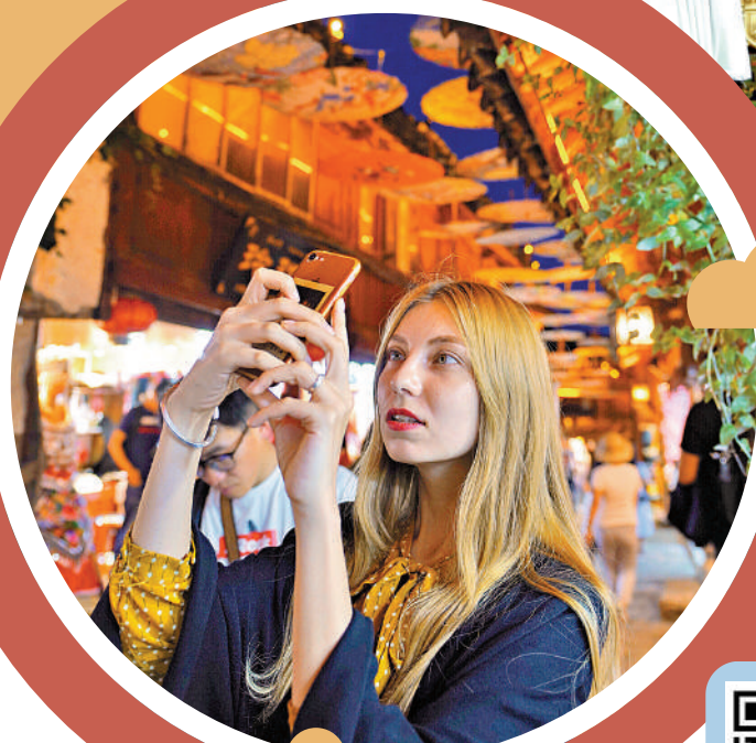
▲在雲南麗江古城，外國遊客在拍攝油紙傘古街風貌。