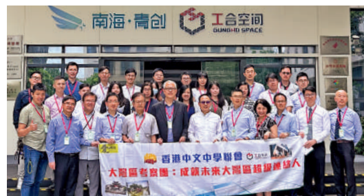
▲考察團成員到佛山粵港青年創業基地工合空間