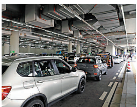
▲車輪經港珠澳大橋口岸通關現場。

【大公報訊】記者方俊明珠海報道：「港車北上」7月1日起可經港珠澳大橋入粵，而「澳車北上」早在今年元旦起走先一步。數據顯示，港珠澳大橋海關已累計監管驗放進出境「澳車北上」單牌車超過30萬輛次；目前依然火爆，澳車北上預約系統顯示端午假期北上名額已提前一周全部約滿。而為迎接「澳車」「港車」，