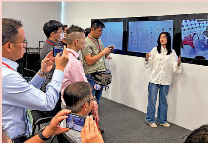
▲香港校長團在廣東元展科技參觀汽車的三維數字模型。